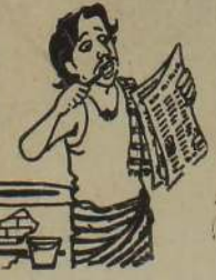
எதிர்க்கட்சிகள் என்றால் அரசு நடத்திறமை எதிர்க் கட்சிக்கு அல்லது பகிஷ்கரிக்க வேண்டும் என்று ஆர். பிரதே நாச பிடிக்கினம் போல... ...பிஷ்கரி...

யாழ். நகரில் யோராணி மரணம் யாழ்ப்பாணம், பெப். 8 யாழ்ப்பாணம் பழைய பூங்காப் பகுதியில் நேற்று தவறுதலாக துப்பாக்கி வெடித்ததில் யோராணி ஒருவர் மரண மாளார். (9)