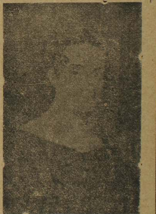
பெண்களுக்கான முதலாவது பாடசாலையை உடுவில் ஆரம்பித்த ஹரிபத் ஷீட்சிவர் அம்மையார்.