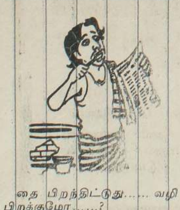
தை பிறந்திட்டுது..... வழி பிறக்குமோ.....?