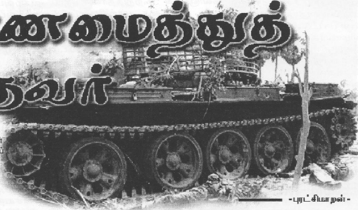
- புரட்சியாளன் -

அந்த இரத்தம் சித்திய நாளொன்றிற்குள் நான் சென்றகொண்டிருக்கிறேன். முன்னாள் அரண்கள் விழிப்பாக இருக்கின்றன. இரவுப் பொழுதாயினும் அமைதி என்ற பேச்சுக்கே இடமில்லாமல் எறிகணைகள் வீழ்ந்துவெடித்து அமைதியை சிதைத்தது. கொண்டிருந்த போராளிகள் அந்தத் திசையிலும் தலைவைத்து நிம்மதியாகத் தங்கமுடியாது ஏனெனில் ஒருபொழுது வறங்கல் பாதையைத் தவிர சுற்றிவர எதிரியின் முற்றுகைக் குழல். அதைவிட கடந்து சென்ற ஒவ்வொரு நாளிலும் அங்கிருந்து உறவாயுங்கள் ஒவ்வொருவரால் பாதித்திருக்க மடிந்தபோது இதுவரையில் இயலாமையால் ஏற்பட்ட வேதனைகள். அந்த நிலைமைகளால் மறக்க முற்பட்டாலும் அதை நினைவுபட்டிக் கொண்டிருக்கும் இரத்தக்கறைகள். தன்னை எந்தியவைகள் காணாது ஏங்கியபடி மும்சுட்டையின் ஓரையில் கிடக்கும் துப்பாக்கிகள். இனி விடியப்போகும் நாளில் எஞ்சியிருப்போரின் பாதை இழக்கப்போகின்றோமே என்ற ஏக்கம். என்றவாறும் ஒவ்வொரு வண்ணக்களையும் மயம் மாறிமறி நினைத்துக் கொண்டிருந்தாலும் மட்டையவற்றையும் எதிர்கொள்ளும் மனவுறுதி மட்டும் இன்றும் குலையாமல் மிச்சமாம் இருந்தது. காலை விடியப்போவதை சேவல் கூவி உறுதிப்படுத்தாவிட்டாலும் அதிகரித்த எறிகணை வீச்சு அதை உணர்ந்தி நின்று. இன்று சூழப்போகும் சமரையற்றி நேற்றைய தினமே