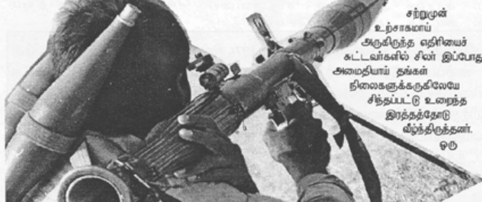
சுற்று முன் உற்சாகமாய் அருகிருந்த எதிரியைக் கட்டவர்களில் சிலர் இப்போது அமைதியாய் தங்கள் நிலைகளுக்குக்கேலேயே சித்தப்பட்டு உணர்ந்த இரத்தத்தோடு வீழ்ந்திருந்தனர். ஒரு

நீர்மலம் காந்திய விட்டது 'இப்போது எங்களுக்கு எதுவும் வேண்டாம் எங்கள் தேசத்தைத் தவிர.' என்ற உறுதியோடு மீண்டும் உக்கிர சண்டைக்குத் தயாரானார்கள் போராளிகள். எதிரியின் முற்றுகைக்குள்ளான பகுதியை திரு முனைகளால் முன்னேறிக் கைப்பற்றுவதற்காகச் சண்டையைத் தொடங்கினார்கள். மீண்டும் அந்த ஆடிவசத்தாக்குதல்களில் எங்கள் காலையார் ஒவ்வொன்றாக மீட்டப்பட்ட தொடங்கியது. எதிரிக்கும் சாவு எங்களுக்குள் இருப்பு ஆனால் வெற்றி மட்டும் எதிரிக்கு கட்டவிடாமல் என்ற வெறித்தனத்தோடு ஒவ்வொரு போராளியும் சேரிட்டார். மரங்களும், கட்டிடங்களும் அந்தக் குண்டு மழையையும் தங்களது சிதைத்த போதும், சிதைதயாத வெறுத்தியோடு ஒரு மாண்போர் அங்கே முண்டிருந்தார்.