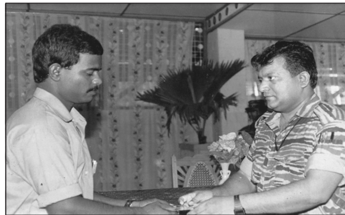
யாழ்ப்பாணத்துக்கும் இடையேதான் அவனது பணி.

பிற்காலத்தில் புலனாய்வு நிர்வாகப் பணிகளினுள் உள்ளிவாங்கப்பட்டான். வன்னிக்கும்