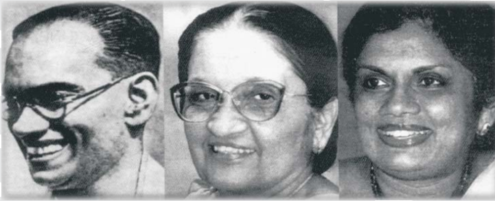
பரிந்து பேசுதல், பிரச்சி