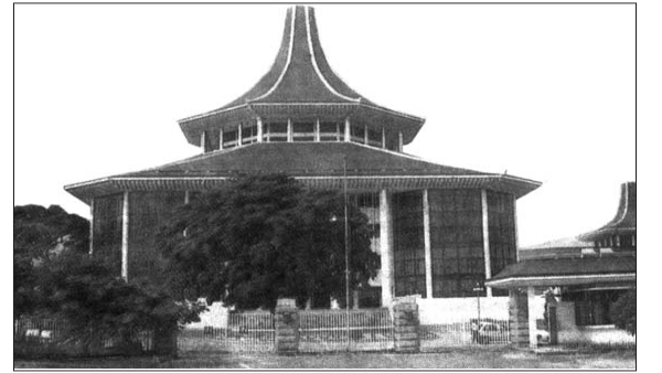
சிறிலங்காவின் உயர் நீதிமன்றக் கட்டடம்