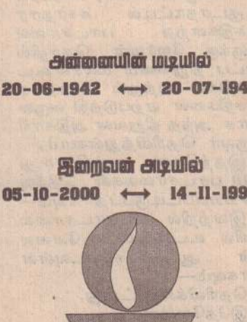
திருமதி இராச இராசம்மா

அன்னையின் மடியில் 20-06-1942 ↔ 20-07-1947