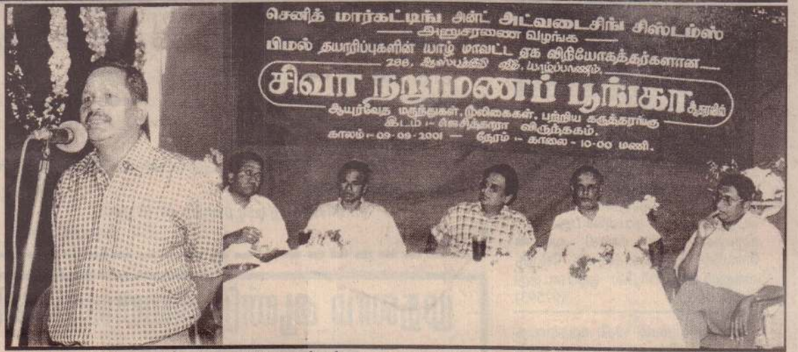
செனிக் மார்கட்டிங் திட்ட அட்வைசரிங் சிஸ்டம்ஸ் அனுசரணை வழங்கும் பிமல் தயாரிப்புகளின் யாழ் மாவட்ட ஏக விநியோகத்தர்களான சிவா நறுமணப் பூங்கா ஆயர்வேத மருந்துகள், முலிகைகள், பற்றிய கருத்தரங்கு இடம்:- சிவசிகரண விருங்கம். காலம்:- 09-09-2001 - நேரம்:- காலை - 10-00 மணி.

'இரத்தின வாசா' கரவெட்டி கிழக்கு. - குடும்பத்தினர். கரவெட்டி. (92544)