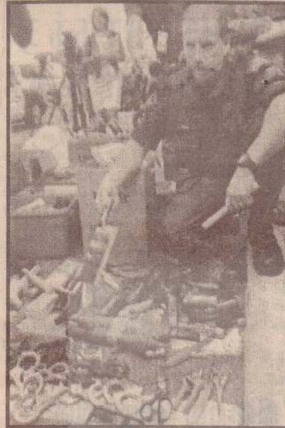
விமானத் தற்கொலைத் தாக்குதல்களையடுத்து அமெரிக்க விமான நிலையங்களில் கெடுபிடிகள் அதிகரித்துள்ளன. தாக்குதல்கள் நடத்தப் பயன்படுத்தப்பட்ட விமானங்களைத் தற்கொலை தாக்குதலாளிகள் கத்தியைக் காட்டிக் கடத்தியதாக தெரிவித்ததையடுத்து சவரப் பீரோக்கள், நகம்வெட்டிகள், பழம்வெட்டும் சிறிய கத்திகள், கத்தரிக்கோல் போன்ற பொருள்களை விமானங்களில் எடுத்துச் செல்லத் தடை விதிக்கப்பட்டுள்ளது. சிவ்வாறான சுமார் ஐயாயிரம் பொருள்கள் தினமும் ஒவ்வொரு விமான நிலையத்திலும் பரிசீலனை செய்யப்படுகின்றன. அமெரிக்க விமான நிலையம் ஒன்றில் அப்படித் தடைப்படுத்தப்பட்ட பொருள்களை படத்தில் காணலாம்.

சர்வதேச நிதி நிறுவனங்களிடமிருந்து உடனடியாக உதவிகளைப் பெறவும் - அதிகளவில் இராணுவப் பரிமாற்றங்கள் இடம்பெறவும், பாதுகாப்புத் துறையில் ஒத்தழைப்புகளைப் பெறவும் - இந்திய, பாகிஸ்தானிய ஆராய்ச்சி நிறுவனங்கள் அமெரிக்க நிறுவனங்