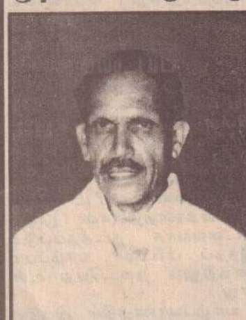
அமரர் கந்தன் இராச