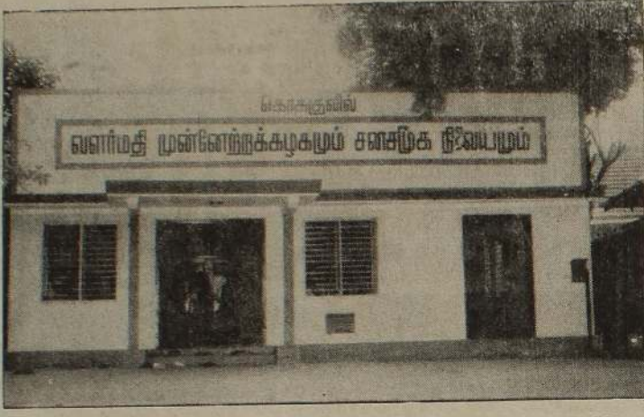
கொக்குவில் வளர்மதி முன்னேற்றக் கழக கட்டடத்தின் தோற்றம்