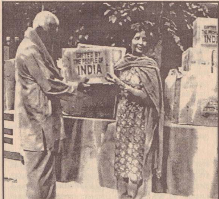
இந்திய உயர்ஸ்தானியர் திருமதி நிருபமா ராவ் அவர்கள் சுனாமியால் பாதிக்கப்பட்ட மக்களுக்கு நிவாரணப்பொருட்களை இராமகிருஷ்ணமிசன் ஊடாக வழங்குகிறார்.

யல் கட்சிகளும் சமூக அக்கறை கொண்ட கல்விமான்கள் மற்றும் சிவில் சமூகத்தாரும் தயாராக வேண்டும். பிரமிட் வடிவிலான எமது அதிகார கட்டமைப்பு சாதாரண மக்களை எப்போதும் இரண்டாம் பட்சமானதாகவே கருதுகிறது.