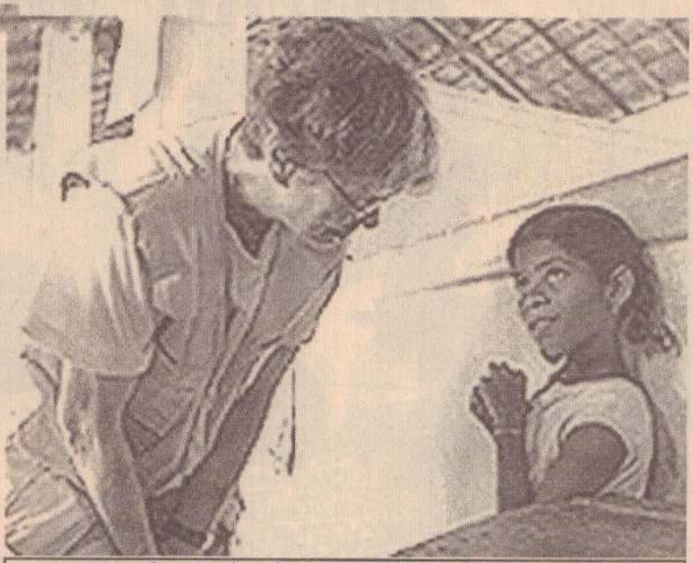
ஐ.நா சிறுவர் நிதியத்தின் பிரதிநிதி சிறுமியுடன் உரையாடுகிறார்

புலிகள் இயக்கமும் அவர்களின் மனிதாபிமான பிரிவான தமிழர் புனர்வாழ்வுக் கழகமும் தமிழ்ப் பகுதிகளில் உள்ள நிவாரணப் பணிகள், முகாம்கள் மற்றும் அநாதை இல்லங்கள் என்பவற்றை தமது கட்டுப்பாட்டுக்குள் வைத்திருக்க மேற்கொள்ளும் முயற்சிகளை முடிவுக்குக் கொண்டு வருவதோடு, பக்க சார்பற்ற உள்ளூர் மற்றும் சர்வதேச அமைப்புகள் எவ்வித தங்கு தடையுமின்றி தமது பணிகளை மேற்கொள்வதற்கு இடமளிக்க வேண்டும் என்றும் பிரதம மந்திரி அவர்களைக் கோர வேண்டும் என ஹியூமன் ரைட்ஸ் வொச் அமைப்பு வலியுறுத்தி உள்ளது. அத்தோடு எதிர்வரும் காலத்தில் நடக்கக்கூடிய எந்த விதமான சமாதானப் பேச்சுக்