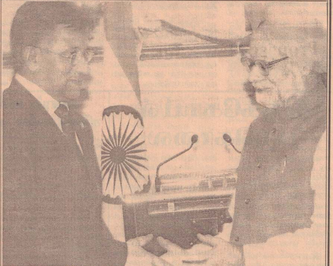
இந்தியா - சீனா - இந்தியா - பாகிஸ்தான் எல்லை கடந்த உறவு தென்னாசியாவின் புதிய அத்தியாயம்