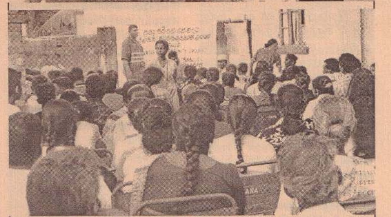
கனாமியால் பாதிக்கப்பட்டவர்களுக்கு இயன்றவரை உதவி