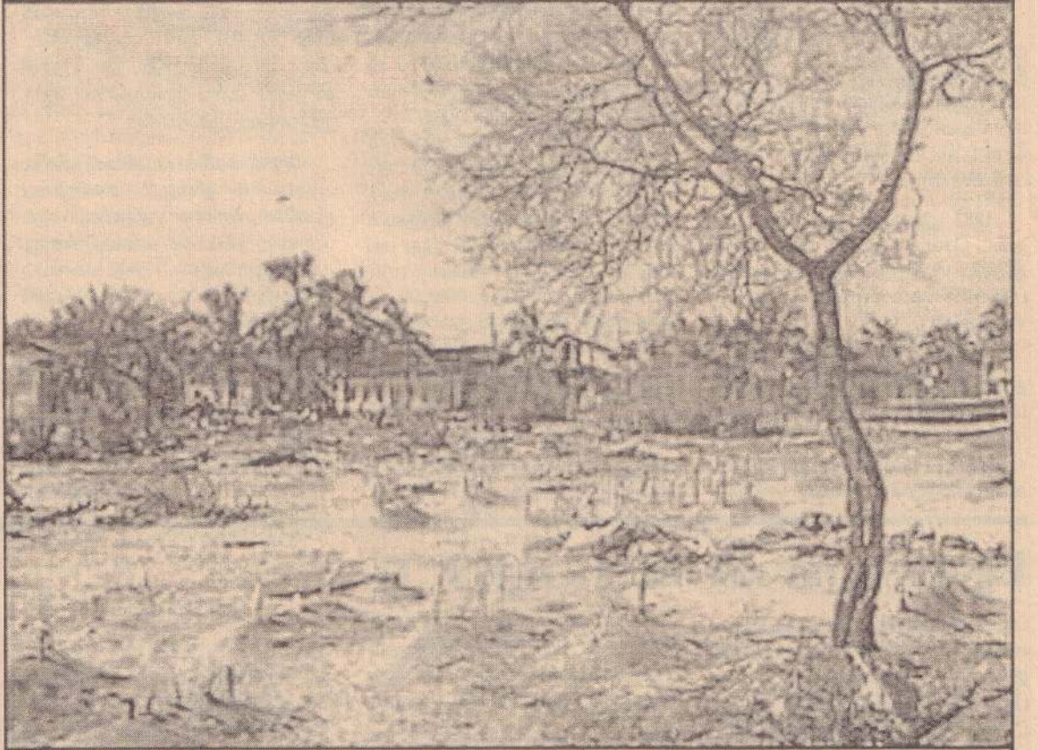
இலங்கையில் கடலோர நாகரீகம் தன் புதைகுழியிலிருந்தே உயிர்த்தொழுவேண்டும். படுகொலை நிறுத்தப்படுவதே சுமாயால் பாதிக்கப்பட்ட மக்களுக்கு நிவாரணப்பணிகளை முழுமையாக மேற்கொள்ள வழிவகுக்கும்.