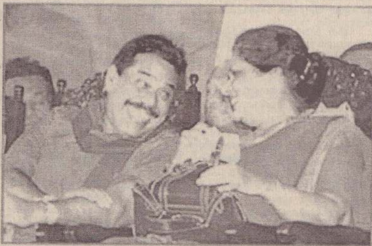
தெரியும், நாளாந்தம் நிகழும் மனித உரிமை மீறல்கள், ஜனநாயக விரோத நடவடிக்கைகள் தொடர்பாக தீவிர அக்கறைக்கொள்ள வேண்டியவர்களாக இருக்கின்றோம். நாட்டையும்,

எதிர்வரும் ஜனாதிபதித் தேர்தலில் ஈழ மக்கள் பரிசீலனை செய்து முன்னணிப் பதமறாபா அதிகாரப் பரவலாக்கல், ஜனநாயகம், மனித உரிமைகள், பன்முகத்தன்மை, இலங்கையின் அதிகாரக் கட்டமைப்பை ஜனநாயகமயப்படுத்துவது, மக்களின் சுதந்திரமான ஜக்கியத்தின் ஊடாக இலங்கை என்ற தேசத்தை நிர்மாணிப்பது ஆகிய தேசிய முக்கியத்துவம் வாய்ந்த விடயங்களை வலியுறுத்துகிறது.