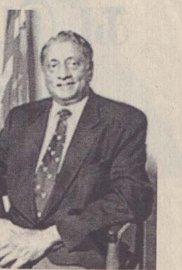
9. 1983 இனவன்முறை தொடர்பாக அரசு என்ற வகையில் பகிரங்கமாக மன்னிப்பு கோரியதும், விசாரணை கமிஷன்கள் அமைத்தது.