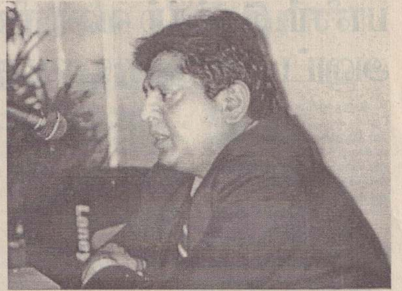
வெதும்பினார். அவரது தீவிர சமூக ஈடுபாடு அவருடைய சொந்த வாழ்க்கையையே சிதைத்தழித்தது.

சகோதர படுகொலைகள் தான் சார்ந்த சமூகத்தில் தலையெடுத்த போது அவர் பெரிதும் மனம்