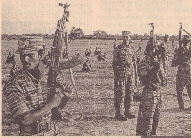
“இறுதி யுத்தத்திற்கு” நிதியுதவி செய்தல் புலம் பெயர்ந்த தமிழர்களிடம் புலிகள் இயக்கத்தின் அச்சுறுத்தல்களும் பலாத்கார பண்பற்றிப்புமும்

புலிகள் இயக்கத்தினரும் அவர்களைத் தொடர்புடைய உலகத் தமிழர் இயக்கம் போன்றவர்களும் தொடர்ச்சியாக திரும்பத் திரும்ப தமிழ் குடும்பங்களுக்கு தொலைபேசி அழைப்புக்களை விடுத்து தமக்கு நிதி வழங்கும்படி நச்சரித்தனர். சில குடும்பங்களின் வீடுகளுக்கு, ஒரு கிழமைக்குள் மூன்று தடவைகளுக்கு மேல்கூட இவர்கள் சென்றுள்ளனர். அக்குடும்பத்தினர்கள், தங்கள் நிதி வழங்குவோம் என உறுதி கூறுவனரை, இந்த நிதி சேகரிப்பாளர்கள் அவர்களின் வீடுகளை விட்டு வெளியேறவும் மறுத்துள்ளனர். அது மட்டுமன்றி தங்களிடம் தற்போது பணம் கையிருப்பில் இல்லை எனக் கூறியவர்களிடம், யாரிடமாவது கையாறாக பெற்றுத்தருங்கள், அல்லது உங்களுடைய வங்கிக் கணக்கு அட்டைகளைப் (Credit Cards) பறித்து அல்லது உங்கள் வீடுகளை