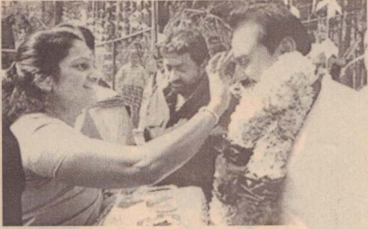
ஜனாதிபதி மலையக விஜயத்தின் போது