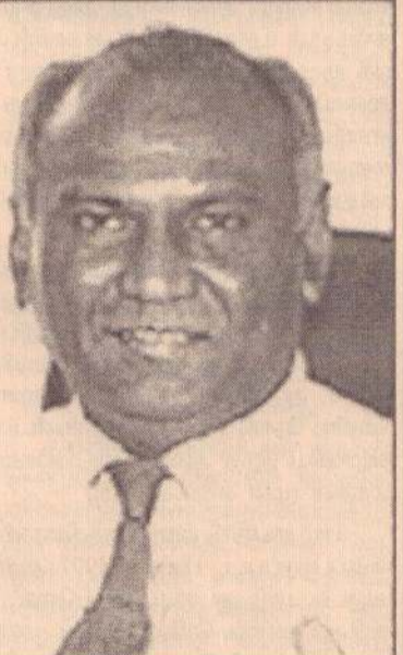
யாழ்ப்பாணப் பல்கலைக்கழகம் ஆரம்பிக்கப்பட்ட 70 களின் நடுப்பகுதியிலும் சரி, 80களின் முற்பகுதியிலும் சரி இலங்கையின் வேறு பகுதிகளிலும், பல்வேறு நாடுகளிலும் பணியாற்றிய விரிவுரையாளர்கள் அங்கு வந்து பணியிய முன்வந்தனர்.

ஆனால் கேவலம் ஒரு தலைசிறந்த கல்வியாளரை தான் சார்ந்த சமூகத்திற்கு தனது சேவையை செய்யும்