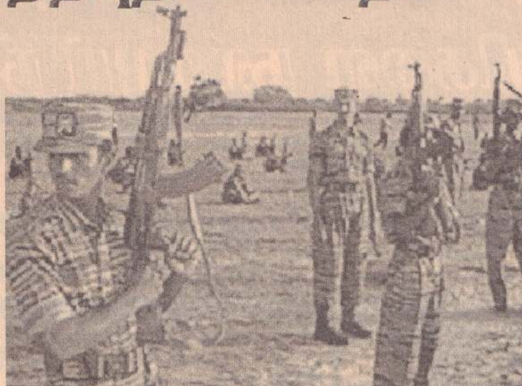
Funding the "Final War" THE Infiltration and Export of the Tamil Diaspora

புலிகள் இயக்கமும் அதன் முன்னணி அமைப்புக்களும், வர்த்தக நிலையங்கள் மற்றும் வீடுகளில் உள்ள தனி நபர்களையும் நேரடியாக அணுகி தமக்கான நிதி பங்களிப்புகளை செய்