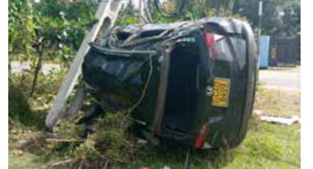
சேர்ந்த - கடல் அட்டை ஏற்றுமதி செய்யும் - ஒருவருக்குச் சொந்தமானது எனவும் தெரிவிக்கப்படுகின்றது.

சீன நாட்டவர் பயணித்த வாகனம் மன்னார் மாவட்டம் முசலிப் பகுதியைச்