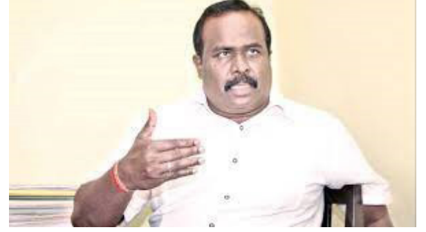
இருக்க கூடாதென மக்கள் கோருகின்றனர். அந்த சூழலில் தான் மக்கள் பார்க்கின்றார்கள். அந்தவகையில் ஐனாதிபதி இருக்கும் வரைக்கும் இந்த எதிர்ப்பு தொடர்ச்சியாக இருக்கும் என சுட்டிக்காட்டியுள்ளார்.