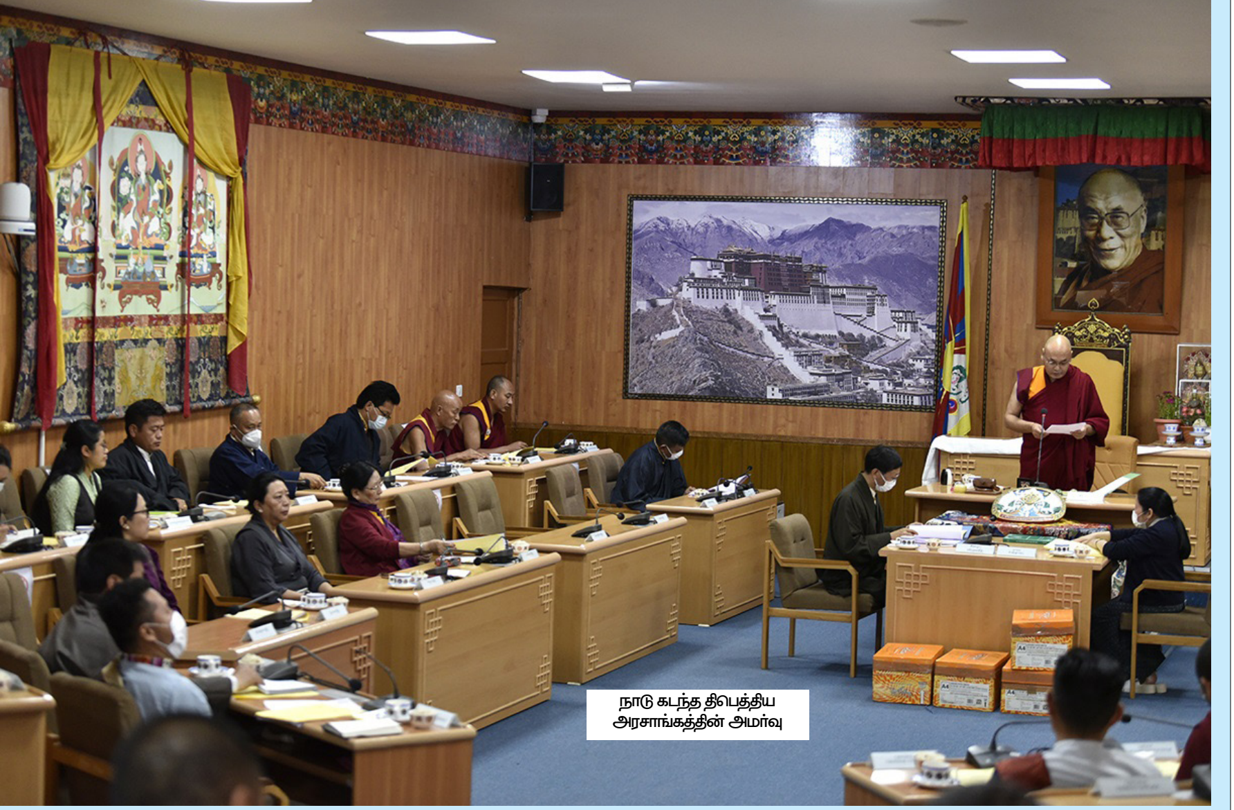
நாடு கடந்த திபெத்திய அரசாங்கத்தின் அமர்வு