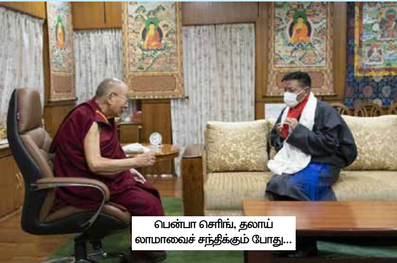
பென்பா செரிங், தலாய் லாமாவைச் சந்திக்கும் போது...

தலாய் லாமாவின் பிரதிநிதிகளுக்கும் பெய்ஜிங்கின் பிரதிநிதிகளுக்கும் இடையே 2002 முதல் ஒன்பது சுற்று பேச்சுகள் நடந்த போதிலும், சீன அரசு மைப்பின் கட்டமைப்பின் கீழ் உண்மையான சுயாட்சியை நாடும் நாடுகடந்த திபெத்திய அரசாங்கத்தின் உத்தியோகபூர்வ நிலைப்பாடான நடுத்தர வழி அணுகுமுறையை சீனா நிராகரித்தே வந்துள்ளது என்பது குறிப்பிடத்தக்கது.