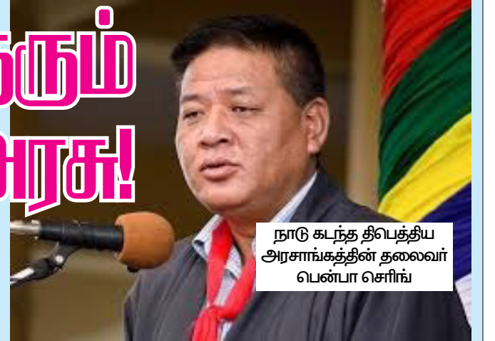
நாடு கடந்த திபெத்திய அரசாங்கத்தின் தலைவர் பென்பா செரிங்

சீனாவிற்கு எதிரான பிரிவினைவாத நடவடிக்கைகளை மேற்கொள்வதற்காக அமைப்பை புறக்கணித்து, அனுமதியின்றி வெளிநாட்டில் இருக்கும்போது ஒரு குழந்தையை 'பஞ்சன் லாமாவின் மறுபிறவி' என்று அறிவித்தார், இது சட்டவிரோதமானது மற்றும் செல்லாது. தேர்ந்