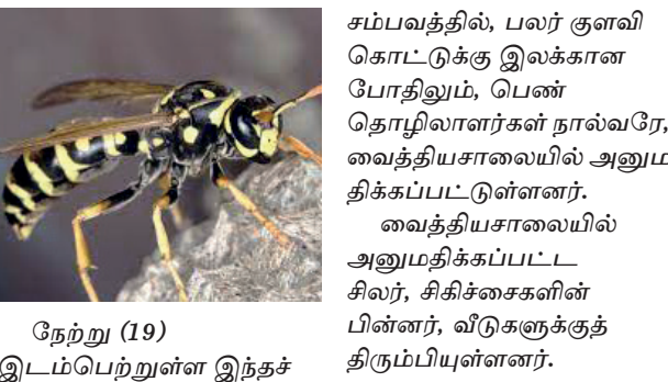
நேற்று (19) இடம்பெற்றுள்ள இந்தச் சம்பவத்தில், பலர் குளவி கொட்டுக்கு இலக்கான போதிலும், பெண் தொழிலாளர்கள் நால்வரே, வைத்தியசாலையில் அனுமதிக்கப்பட்டுள்ளனர். வைத்தியசாலையில் அனுமதிக்கப்பட்ட சிலர், சிகிச்சைகளின் பின்னர், வீடுகளுக்குத் திரும்பியுள்ளனர்.

லுணுகலை, அடாவத்தை தோட்டத்தில் பெண் தொழிலாளர்கள் நால்வர், குளவி கொட்டுக்கு இலக்காகி, லுணுகலை அரசினர் வைத்தியசாலையில் சிகிச்சை பெற்று வருகின்றனர்.