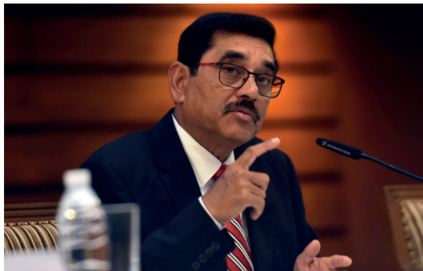
(19) ஏற்பாடு செய்யப்பட்டிருந்த செய்தியாளர் சந்திப்பின் போதே அவர் இதனை கூறினார். அவர் மேலும் கூறுகையில்,

பொதுமக்கள் தமது கையிருப்பில் பணமாக வைத்திருக்கக்கூடிய வெளிநாட்டு நாணயத்தின் பெறுமதியானது 15,000 டொலரில் இருந்து 10,000 டொலராகக் குறைப்பது குறித்து மத்திய வங்கி ஆராய்ந்து வருவதாகவும், சட்டவிரோதமாக அல்லது ஏதேனும் காரணங்களின் அடிப்படையில் அவ்வாறான வெளிநாட்டு நாணயத்தை சேகரித்து வைத்திருப்பவர்கள், இரண்டு வாரங்களுக்குள் வங்கியில் வைப்பு செய்யவோ அல்லது இலங்கை ரூபாவுக்கு மாற்றிக்கொள்வோ வேண்டும் என மத்திய வங்கியின் ஆளுநர் கலாநிதி நந்தலால் வீரசிங்க தெரிவித்தார். மத்திய வங்கியால் நேற்று