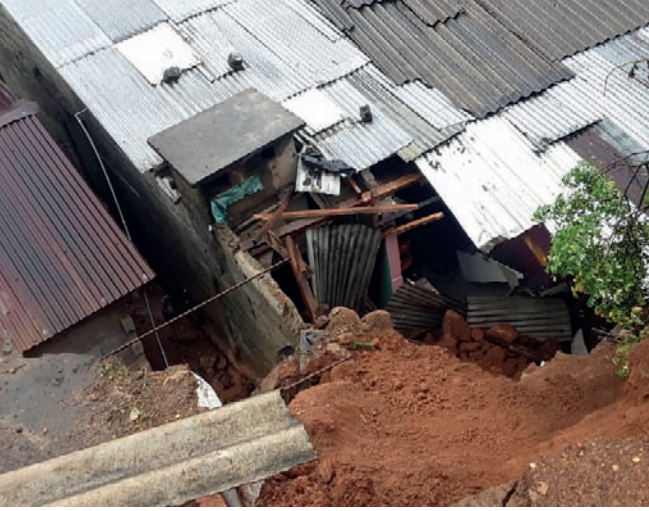
பாதிக்கப்பட்டவர்கள் தெரிவித்தனர். தொடர்ந்து இப்பகுதியில் மழை பெய்து வருவதால் அப்பகுதியில் மண் சரிந்து விழுவதை அவதானிக்கக்கூடியதாக

தலவாக்கலை, வேமச்சந்திரா மாவத்தை பகுதியில் 50 அடி உயரத்திலுள்ள மதில் நேற்று (19) காலை 6.30 மணியளவில், சரிந்து விழுந்ததில் நான்கு குடியிருப்புகள் சேதமாகியுள்ளன. இதன்போது 53 வயதுடைய பெண் ஒருவருக்கு கைகளில் காயங்கள் ஏற்பட்டுள்ளதோடு, அவர் உடனடியாக தலவாக்கலை தோட்டத்தில் இயங்கும் வைத்திய நிலையத்தில் சிகிச்சை பெற்று வீடு திரும்பியுள்ளார். கர்ப்பிணியொருவர் எவ்வித ஆபத்துகள் இன்றி தெய்வாஜைமாக உயிர் தப்பியுள்ளார். அத்தோடு, வீடுகளில் கவர்சன் இடிந்து விழுந்துள்ளதோடு, வீடுகளில் இருந்த பெறுமதிமிக்க பொருட்களும் மண் மேட்டில் புதைந்துள்ளதாக