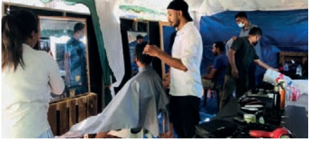
42ஆவது நாளை எட்டியுள்ள கோட்டா கோ கமவில் ஆர்ப்பாட்டத்தில் ஈடுபடுவோர் இங்கு இலவசமாக சிகை அலங்காரத்தை மேற்கொள்ள

அரசு எதிர்ப்பு ஆர்ப்பாட்ட இடமான காலிமுக்கத்திடல் 'கோட்டா கோ கம'வில் சிகை அலங்கரிப்பு நிலையம் ஒன்று திறந்து வைக்கப்பட்டுள்ளது.