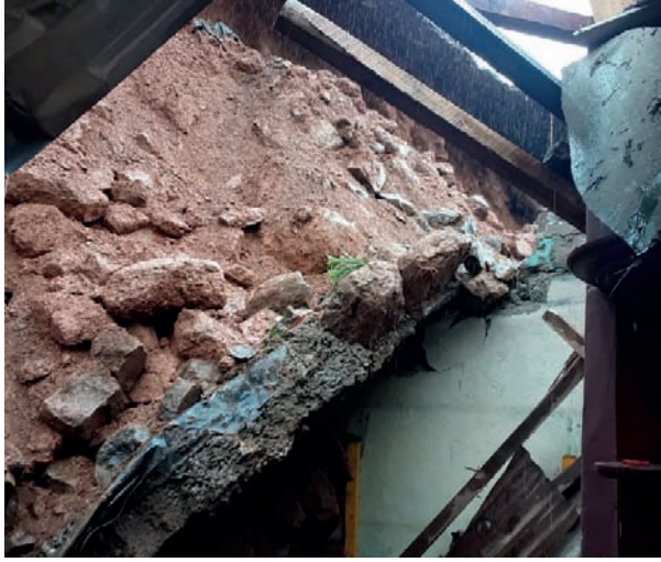
இருக்கின்றது. மேலும், பாதிக்கப்பட்ட நான்கு குடும்பங்களைச் சேர்ந்த 25 பேர் உறவினர்கள் வீடுகளில் தங்கியுள்ளனர். பாதிக்கப்பட்ட