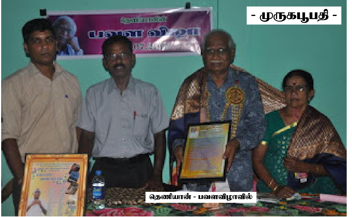
- முருகபூபதி -

நூறுக்கும் மேற்பட்ட சிறுகதைகளும் பல நாவல்களும் சில விமர்சனக் கட்டுரைத் தொகுதிகளையும் தமிழ் இலக்கியத்திற்கு வரவாக்கியிருக்கும் தெனியானின் பாதுகாப்பு என்ற சிறுகதை யாழ்ப்பாணத்திலிருந்து வெளியாகும் ஜீவநதியில் வெளிவந்தது.