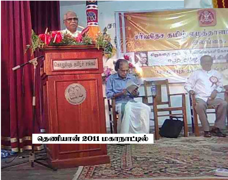
தெனியான் 2011 மகாநாட்டில்

இலங்கையில் மல்லிகை, ஞானம், கனடா காலம் முதலான கலை, இலக்கிய இதழ்கள் தெனியானை அட்டைப்பட அதிதியாகவும் பாராட்டி கௌரவித்துள்ளன. வடபுலத்தின் அடிநிலை மக்களின்