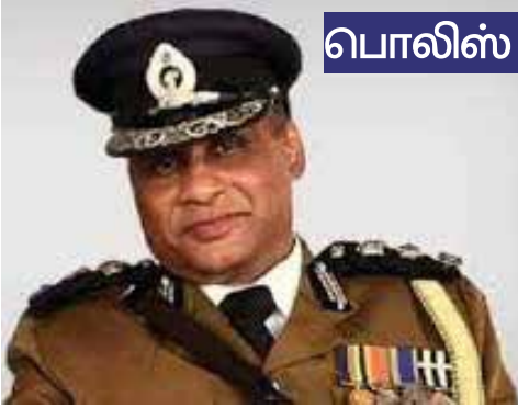
பொலிஸ் மா அதிபர் பகிரங்க குற்றச்சாட்டு

ஜனாதிபதி கோட்டாபய ராஜபக்ஷ உள்ளிட்ட அரசாங்கத்தை பதவி விலக்கக்கோரி ஆர்ப்பாட்டத்தில் ஈடுபட்டு வந்த 'மைனா கோ கம்', 'கோட்டா கோ கம்' அமைதிப் போராட்டக்காரர்களின் பாதுகாப்பு தொடர்பாகத் தான் வழங்கிய எழுத்துமூல, வாய்மொழி மூல ஆலோசனைகளை, பொறுப்பான உயர் அதிகாரியாகச் செயற்பட்ட மேல் மாகாண சிரேஷ்ட பிரதிப் பொலிஸ் மா அதிபர் பின்பற்றாதிருந்துள்ளார் எனப்பொலிஸ் மா அதிபர் சந்தன விக்கிரமரத்ன தெரிவித்துள்ளார். பொலிஸ் மா அதிபர் சந்தன விக்கிரமரத்னவிடம் சி.ஐ.டி.யினர் 5 மணி நேரம் வரை விசாரணை நடத்தி வாக்குமூலம் பெற்றனர்.