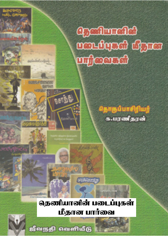
தெனியானின் படைப்புகள் மீதான பார்வை