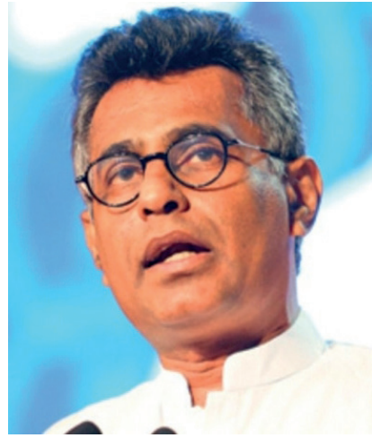
அமைத்தல், ஊழல் மோசடிகளுடன் தொடர்புடைய அமைச்சின் அதிகாரிகள் நீக்கப்படுதல், அனைத்துக் கட்சிகளையும்

கொழும்பில் நேற்று (23) நடைபெற்ற ஊடகவியலாளர் சந்திப்பில் கலந்துகொண்டு கருத்து தெரிவிக்கும் போதே அவர் இதனை கூறினார். அவர் மேலும் கூறுகையில், அமைச்சரவை மேற்பார்வைக்குழு