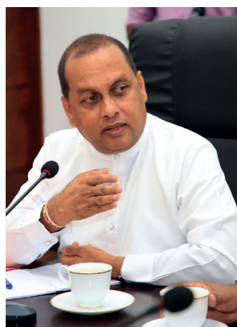
அரசாங்கம் வீழ்ந்து விடாத வகையில் செயற்பட வேண்டும்.

விவசாயம், வன ஐவராசிகள், வன பாதுகாப்பு அமைச்சராக ஜனாதிபதியிடம் நியமிக்கப்பட்டதே நேற்று (23) பெற்றுக்கொண்டதன் பின்னர் ஊடகங்களுக்குக் கருத்துத் தெரிவிக்கும்போதே அவர் மேற்கண்டவாறு தெரிவித்தார். அமைச்சுப் பதவிகளைப் பெற்றுக்கொள்ள வேண்டும் என ஜனாதிபதியும் பிரதமரும் அழைப்பு விடுத்திருந்தனர். அமைச்சு பதவியை பெறுவதற்கு முன்னர் கட்சி தலைவரான மைத்திரிபால சிறிசேனவுக்கு நான் அறிவித்திருந்தேன். அரசாங்கம் வீழ்ந்துவிடாத வகையில் செயற்பட வேண்டும். பொறுப்புகளை எவ்வாறு ஏற்றுக்கொள்ள வேண்டும். எனவே நான் அமைச்சு பதவிகளை ஏற்றிருப்பதால் ஸ்ரீ லங்கா சுதந்திரக் கட்சிக்கு