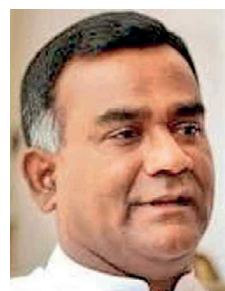
பாரதூரமான நிலையில் வீழ்ந்து கிடக்கும் போது, தங்களுக்கு விரும்பியவாறு அமைச்சர்களை காலத்துக்குக் காலம் நியமிப்பது பாரதூரமான தவறு எனவும் தெரிவித்தார்

கடந்த வாரத்தில் இரு சந்தர்ப்பங்களில் 13 அமைச்சர்கள் நியமிக்கப்பட்டனர். நேற்றும் 10 அமைச்சர்கள் நியமிக்கப்பட்டுள்ளனர். 25 அமைச்சரவை அமைச்சர்களை நியமிக்கவும் நடவடிக்கை எடுத்து வருவதாக தெரிவிக்கப்படுகிறது. நாடு