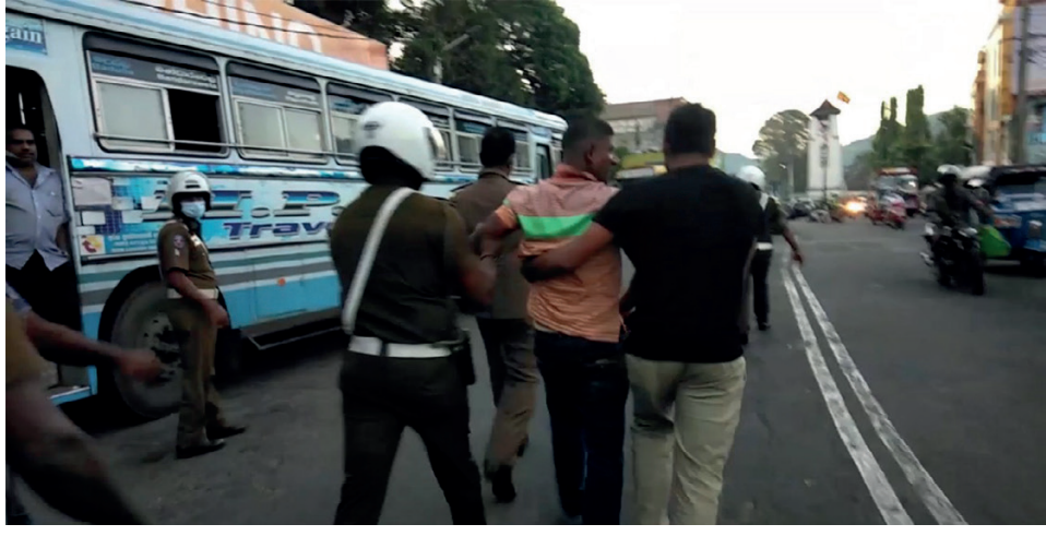
எரிபொருள் வரிசையில் மோதல்