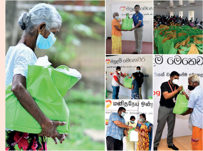
நாட்டின் 25 மாவட்டங்களையும் உள்ளடக்கிய இவ்வரசவை நிவாரண விநியோகம் ஆரம்பிக்கப்பட்டுள்ளது.

தற்போதும் பழைய அமைச்சர்களே மீண்டும் நியமிக்கப்படுகிறார்கள். இவர்கள் அனைவரும் தோல்வியடைந்தவர்கள் என்றே மக்கள் கூறுகிறார்கள். இந்த நியமிக்கல்களால் மக்களுக்கு எதுவும் நடக்கப்போவதில்லை. ஜனாதிபதி கோட்டாபய ராஜபக்ஷவை பாதுகாப்பதற்காகவே பிரதமராக ரணில் விக்ரமசிங்க நியமிக்கப்பட்டுள்ளதாக உதயங்க வீரதுங்க கூறுகிறார். ஜனாதிபதி பதவி விலக வேண்டுமென காலிமுக்கத்திலில் உள்ள போராட்டக்காரர்களின் போராட்டத்தை ரணில் காட்டிக்கொடுத்துள்ளார். நாட்டில் தற்போது டீசல், பெற்றோல் தட்டுப்பாடுகள் அதிகரித்துள்ளன. இதனால் வரிசைகளின் எண்ணிக்கையும் அதிகரித்துள்ளன. புதிய அரசாங்கமாக தற்போதைய அரசாங்கத்தை காட்டுவதற்கு முயற்சிகள் மேற்கொள்ளப்பட்டாலும் பழைய அரசாங்கமே தற்போதும் காணப்படுகிறது. ஜனாதிபதி, ஒட்டுமொத்த அரசாங்கமும் பதவி விலக வேண்டும். இதுவே நாட்டின் நெருக்கடி நிலைமைகளுக்கு ஒரே தீர்வு எனவும் தெரிவித்தார்.