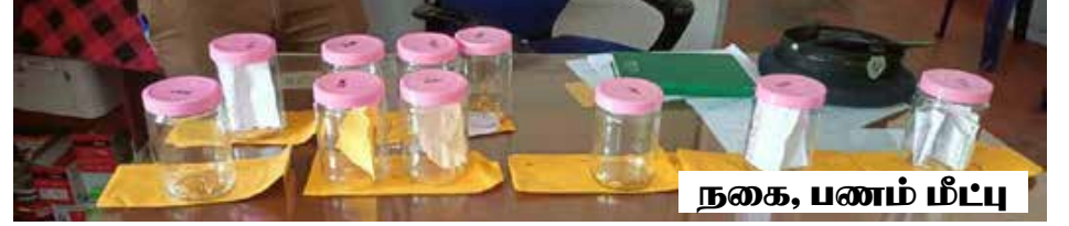
நகை, பணம் மீட்பு

யாழ்ப்பாணம், மே 25 யாழ்ப்பாணத்தில் கடந்த ஒரு வருட காலமாக 6 வீடுகளில் திருட்டில் ஈடுபட்ட நபர் ஒருவர் கைது செய்யப்பட்டுள்ளார்.