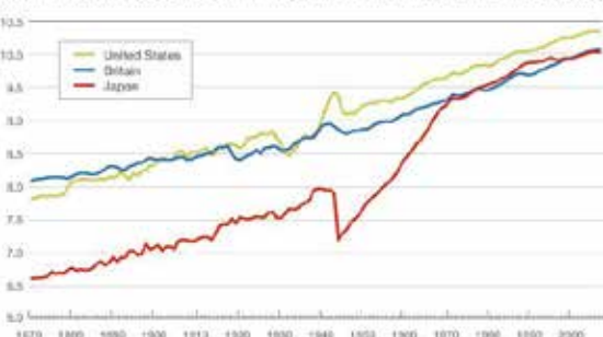
Growth in Real Per Capita GDP in Japan, Britain, and the US, 1870-2008 (Natural log of per capita GDP in 1990 International Geary-Khamis dollars)

Source: The Maddison Project http://www.gao.gov.uk/maddison/maddison-projects/home.htm, 2012 version.