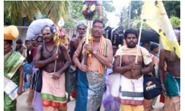
(காரைநகர் நிருபர் சுகர்)

யாழ்ப்பாணம் கதிர்காம பாத யாத்திரை எதிர்வரும் ஜூன் 4 ஆம் திகதி ஆரம்பமாகிறது.