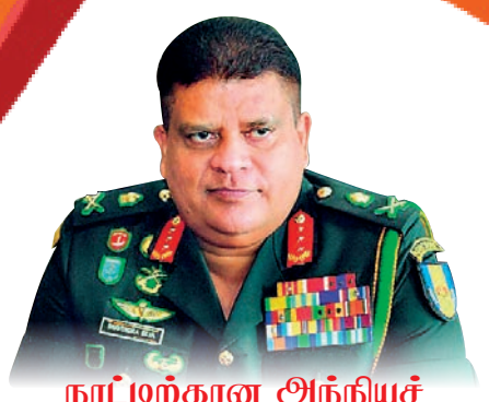
நாடழற்கான அந்தியச் செலாவணியை கொண்டு வர