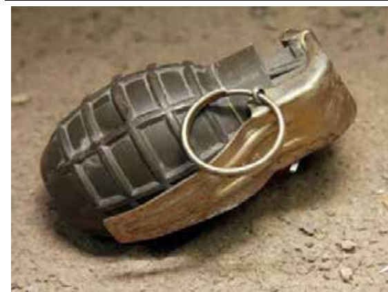
தற்கான நடவடிக்கைகள் முன்னெடுக்கப்பட்டன.

இது தொடர்பான மேலதிக விசாரணைகளைக் கொடிகாமம் பொலிஸார் முன்னெடுத்து வருகின்றனர்