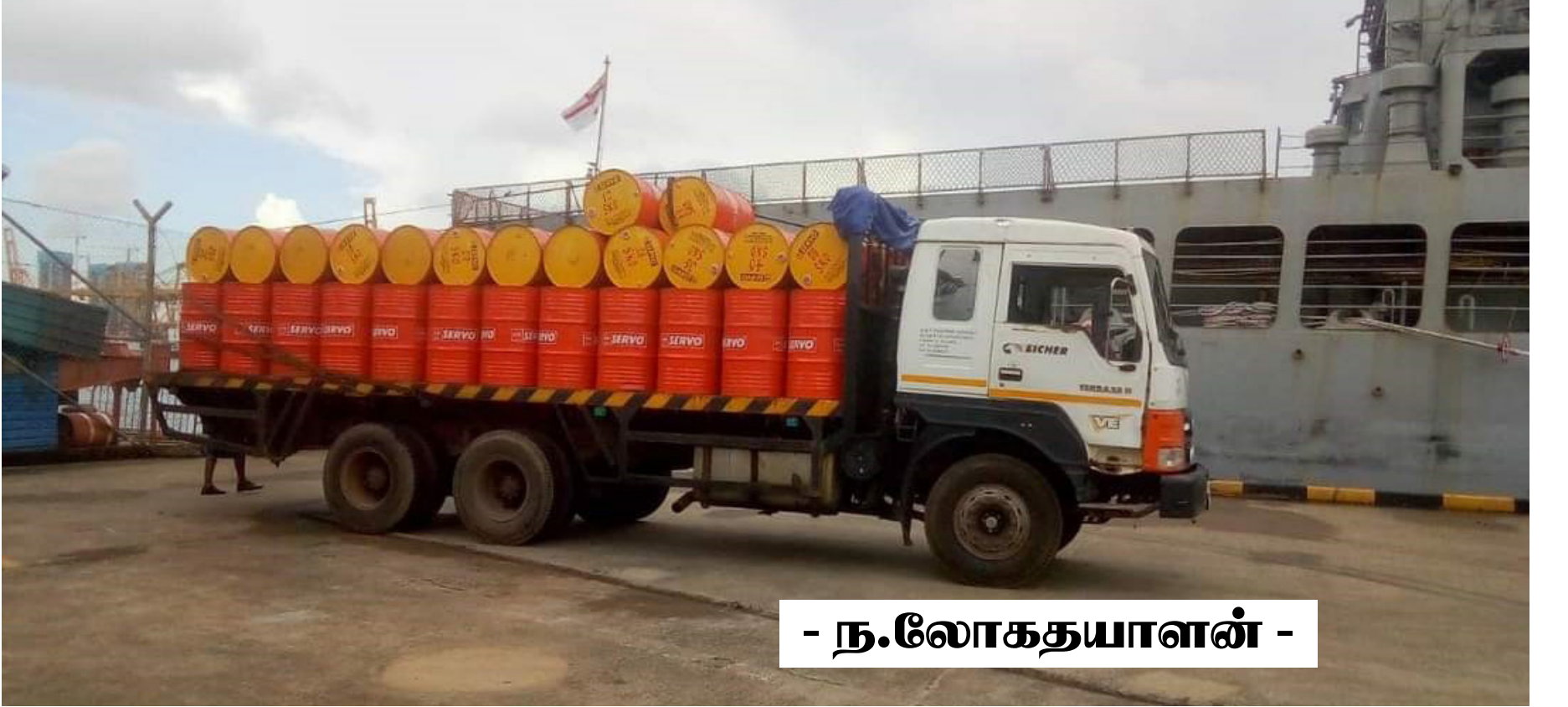
- ந.லோகதயாளன் -