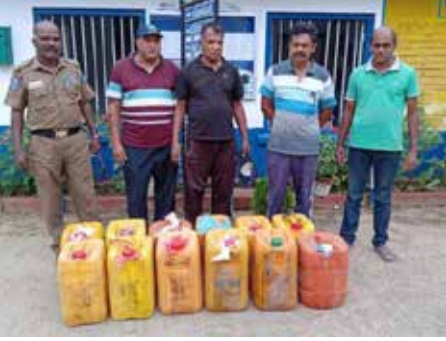
240 லீற்றர் பெற்றோலுடன் 50 வயது நபர் ஒருவர் கைது செய்யப்பட்டுள்ளார்.

பதுளை மாவட்டம், மடூல்சீமை பொலிஸ் பிரிவுக்குட்பட்ட பிட்டமாறுவை பகுதியில் வியாபார நிலையத்தில் அதிக விலைக்குப் பெற்றோல் விற்பனை செய்யப்படுகின்றது எனப் பொலிஸாருக்குத் தகவல் கிடைத்துள்ளது. இதையடுத்து மேற்கொள்ளப்பட்ட சுற்றிவளைப்பின்போது, கொள்கலன்களில் இருந்து மொத்தமாக 240 லீற்றர் பெற்றோல் மீட்கப்பட்டுள்ளது. கைதானவர், பிட்டமாறுவை பகுதியைச் சேர்ந்தவராவார்.