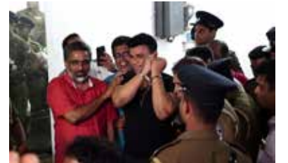
மேற்கொள்ளவுள்ளேன் எனவும் நீதியமைச்சர் அறிவித்துள்ளார்.

அந்தக் கோரிக்கைக்கு அமைவாக ரஞ்சன் விடுதலை தொடர்பில் கூடிய சீக்கிரம் தேவையான நடவடிக்கைகளை