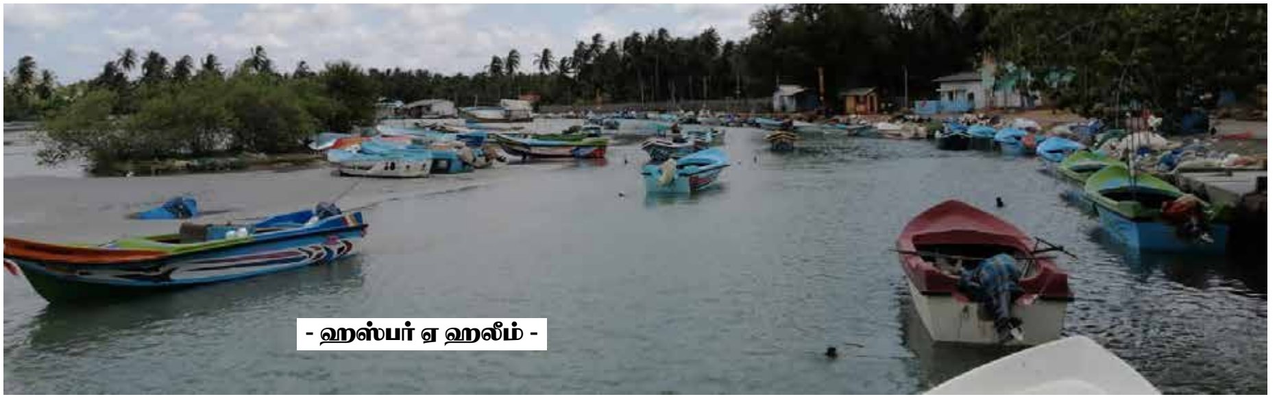
- ஹஸ்பர் ஏ ஹலீம் -