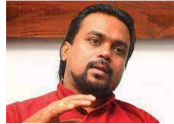
21ஆவது திருத்தச் சட்ட வரைவை ஆராய்ந்து எமது கருத்துக்களை முன்வைத்துள்ளோம். அதனை ஆதரிக்கும் அனைத்து தரப்பினரின் கருத்துக்கள் மற்றும் ஆலோசனைகளின் அடிப்படையில் இறுதி வரைவு தயாரிக்கப்படும் என பிரதமர் குறிப்பிட்டுள்ளார். நாங்கள் முன்வைக்கும் உரிய திருத்தங்கள் உரிய மதிப்பை பெற்றால் 21ஆவது திருத்தத்தை ஆதரிப்பதற்கு எமது கூட்டணி தீர்மானித்துள்ளது - என்றார். (அ)

அரசியலமைப்பு திருத்த பிரேரணை தொடர்பில் பிரதமர் ரணில் விக்கிரமசிங்கவுக்கும் 9 சுயாதீன கட்சிகளின் தலைவர்களுக்கும் இடையில் நேற்று முன்தினம் பிற்பகல் இடம் பெற்ற கலந்துரையாடலின் பின்னர் ஊடகங்களுக்கு கருத்து தெரிவிக்கும்போதே அவர் இவ்வாறு கூறினார். அவர் மேலும் தெரிவிக்கையில் -