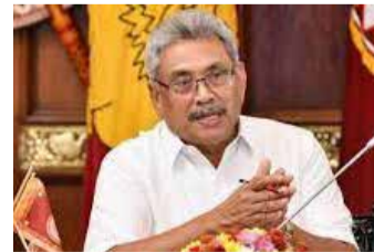
பினால் அது சாத்தியமாக வில்லை என்பது பொதுமக்களின் கருத்து ஆகும். அதனை சரிசெய்து நிலவும் மின்சார நெருக்கடிக்கு தீர்வு காண நடைமுறை ரீதியாக உதவு முடியும் என ஜனாதிபதி தெரிவித்தார். (அ)

வவுனியா, மே 28 வவுனியா நகரில் உள்ள இலுப்பையடிப் பகுதியில் புத்தர் சிலை ஒன்று பிரதிஷ்டை செய்யப்பட்டுள்ளது. வவுனியா, இலுப்பையடிப் பகுதியானது தமிழ் பேசும் மக்கள் அதிகமாக வாழும் பகுதியாகவுள்ளதுடன், தமிழ் பேசும் மக்களின் வர்த்தக நிலையங்களும் அதிகமாகவுள்ளன. இப்பகுதியில் மரம் ஒன்றின் கீழ் பிள்ளையார் சிலை பிரதிஷ்டை செய்யப்பட்டு பல வருடங்களாக அப்பகுதி வர்த்தகர்களும், வீதியால் செல்வோரும் வழிபட்டு வருகின்றனர். இந்நிலையில் இலுப்பையடிப் பகுதியில் அமைந்துள்ள வன்னி பௌத்த இளைஞர் சங்க அலுவலகத்திற்கு முன்பாக வீதியில் செல்வோர் தரிசிக்கும் வகையில் புதிதாக பீடம் நிறுவப்பட்டு புத்தர் சிலை ஒன்று வைக்கப்பட்டு, மின்சார மும் வழங்கப்பட்டுள்ளது. குறித்த புத்தர் சிலை உள்ள பகுதியில் இருந்து 50 மீற்றர் தூரத்தில் தொல்பெருள் திணைக்கள பிராந்திய காரியாலயத்தில் வீதியில் செல்வோர் காணக் கூடியதாக ஏற்கனவே புத்தர் சிலை உள்ள நிலையில் தற்போது புதிதாக புத்தர் சிலை வைக்கப்பட்டுள்ளமை பௌத்த