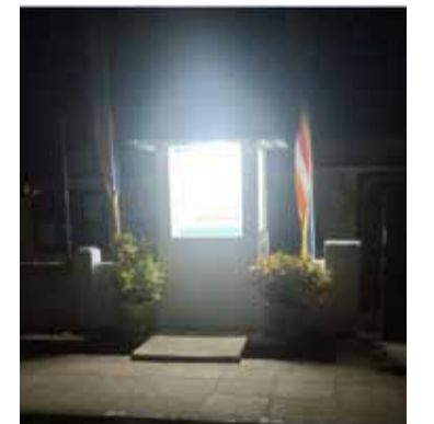
மயமாக்கலின் ஒரு பகுதியான பொதுமக்கள் கேள்வி எழுப்பியுள்ளனர். அத்துடன், கடந்த சில மாதங்களுக்கு முன்னர் வவுனியா-மன்னார் வீதியில் இயங்கி வரும் வவுனியா தெற்கு சிங்கள பிரதேச செயலக வளாகத்திலும் புத்தர்சிலை ஒன்று வைக்கப்பட்டு பிரதிஷ்டை இடம் பெற்றிருந்தது. மேலும், இலுப்பையடிப் பகுதியில் புத்தர் சிலை வைக்கப்பட்டுள்ள இடத்திற்கு முன்பாக உள்ள பிள்ளையார் ஆலயத்தில் காணப்பட்ட பிள்ளையார் சிலை ஜனவரி 23 ஆம் திகதி காணாமல் போயிருந்த நிலையில் மீள பிரதிஷ்டை செய்யப்பட்டு மக்களாலும், வர்த்தகர்களாலும் வழிபடப்பட்டு வருகின்றமை குறிப்பிடத்தக்கது. (அ)