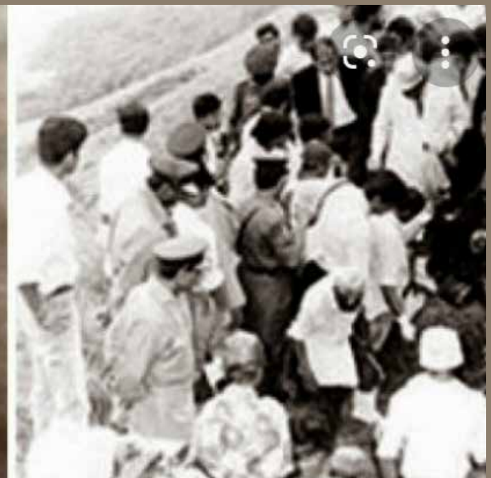
பயங்கரவாதத்தைத் திணிப்பதில் பின்னிற்கிறார் என்றே இதுவிடயத்தில் கூறமுடியும்.