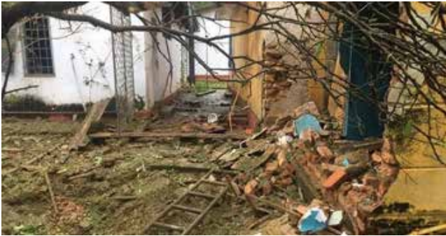
எல்பிட்டிய பொலிஸ் பிரிவிற்குட்பட்ட நாகஹதென்ன, கஜகஸ்வத்த பிரதேசத்தில் வீடொன்றின்

எல்பிட்டியவில் வீடொன்றில் நேற்று திடீர் குண்டு வெடிப்பு