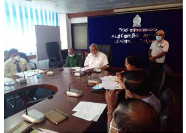
சாதகமான முடிவுகளை பெற்றுக்கொள்ள முடியும் என்று தெரிவித்தார்.

எனினும், விரைவில் ஜனாதிபதியுடனான சந்திப்பின்போது, எளிப்பொருள் போன்ற அடிப்படை தேவைகளை முடிந்தளவு பெற்றுக்கொள்வது தொடர்பாக ஆராய்ந்து