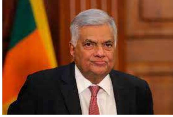
முழு நேர அரசியலில் ஈடுபடுமாறு ஐக்கிய தேசியக் கட்சியின் பொதுச் செயலாளர் பாலித் ரங்கே பண்டாரவுக்கு பிரதமர் ரணில் விக்கிரமசிங்க பணிப்புரை விடுத்துள்ளார். அத்தோடு, ஐக்கிய தேசியக் கட்சியின் அரசியல் செயற்பாடுகளை முன்னெடுத்துச் செல்லுமாறு கட்சியின் பிரதித் தலைவர் ருவான் விஜேவர்தனவிற்கு அவர் பணிப்புரை விடுத்துள்ளார் எனத் தெரிவிக்கப்படுகின்றது.

ஐக்கிய தேசியக் கட்சியின் தலைமையகமான சிறி கொத்தாவில் நடைபெற்ற கட்சியின் சிரேஷ்ட உறுப்பினர்களுடனான சந்திப்பின்போதே அவர் இவ்வாறு தெரிவித்துள்ளார்.