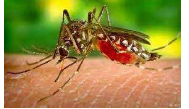
டெங்கு நோயாளிகள் இனங்காணப்பட்டுள்ளனர் எனவும் அவர் சுட்டிக்காட்டியுள்ளார்.

மேல் மாகாணத்தின் கொழும்பு, கம்பஹா மற்றும் களுத்துறை மாவட்டங்களிலேயே அதிகளவான