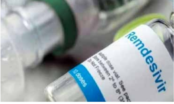
கொரோனாத் தொற்றால் தீவிரமாக பாதிக்கப்பட்ட ஆஸ்பத்திரிகளில் சிகிச்சை பெறுவார்களுக்கு சிகிச்சை

வழங்கும் வகையில் கட்டுப்பாடுகளும் இருந்தன.