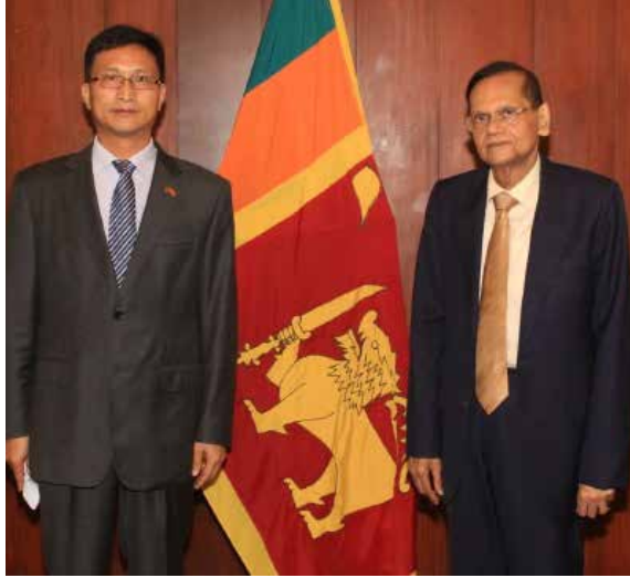
நாடுகளுக்கும் இடையிலான நெருங்கிய நட்பையும் பாராட்டினார்.