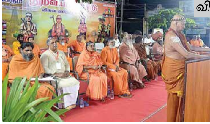
விஸ்வ இந்து பரிஷத்

“கிறிஸ்தவ, முஸ்லிம் புனித தலத்துக்கு செல்வதற்கு இலவசம் அறிவிக்கும் அரசு, இந்துக் கோயில் களில் மட்டுமே தரிசனம் செய்ய கட்டணம் வசூலிக்கின்றனர். வரும் தேர்தலில் இந்துக்கள் கைலாயம் செல்வதற்கு இலவசம் என்பவர் களுக்கே நமது வாக்கு”, என்று அவர் தனது தலைமை உரையில் கூறினார்.