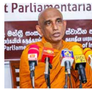
பிரதமராக வந்தபோது அவரால் இந்தப் பிரச்சனையில் இருந்து நாட்டை மீட்க முடியும் என்று குறிப்பிட்டனர். அவர்களின் கருத்துக்களுக்கு மதிப்பளித்து நாங்களும்

கொழும்பு, ஜூன் 07 சர்வதேச நாணய நிதியத்தின் கடன் பெற்ற எந்தவொரு நாடும் சுபீட்சமடையவில்லை என பாராளுமன்ற உறுப்பினர் அத்துரலிய ரத்ன தேரர் குற்றம் சாட்டியுள்ளார். சுயாதீன பாராளுமன்ற உறுப்பினர்களின் செய்தியாளர் சந்திப்பு நேற்றுமுன்தினம் கொழும்பில் நடைபெற்றிருந்தது.