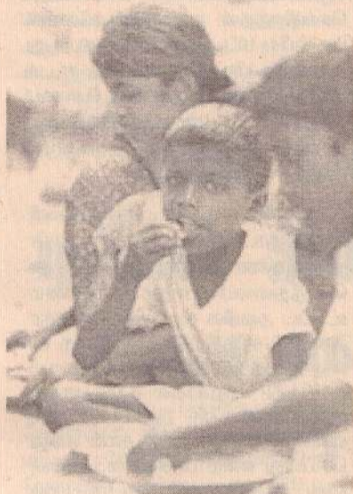
கடந்த வருடம் ஆகஸ்ட் மாதம் தொடக்கம் இடையறாத செல்விச்சுக்கள், வானதாக்குதல்கள் மத்தியில் இடம் பெயர்ந்த மக்கள் வாகரையை தொடர்ச்சி 02ம் பக்கம்

மனித குலத்தின் நியாயமான விடுதலையை நாடி நிற்கும் தர்மீக நெறிமுறைகளை கடைப்பிடிக்கும் சில ஆயுதமேந்திய இயக்கங்களே பல சந்தர்ப்பங்களில் தோல்வியைச் சந்தித்து விடுகின்றன. நிலைமை இவ்வாறிருக்கையில் புலிகளைப் போன்ற ஒரு கடைகெட்ட பாசிச இயக்கம் எவ்வாறு வரலாற்றில் தாக்கு பிடிக்கமுடியும்?