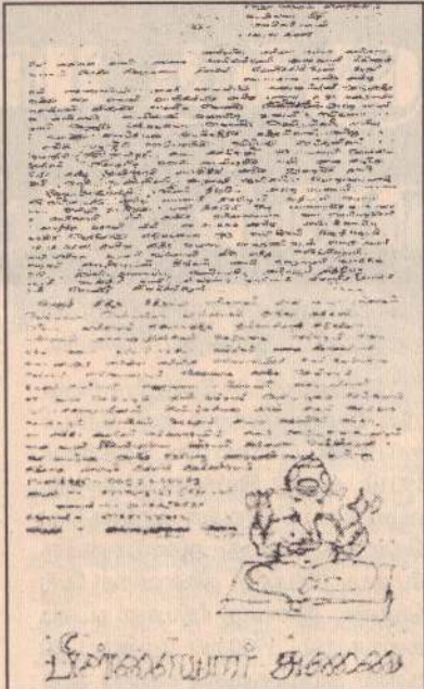
சமூகத்தில் ஈவிரக்கம் எதுவும் மிஞ்சவில்லையென்று அவன் நொந்து போயிருந்தான். சமூகம் மீதான அவனது விமர்சனமாகவும் இக்கடிதம் அமைகிறது.