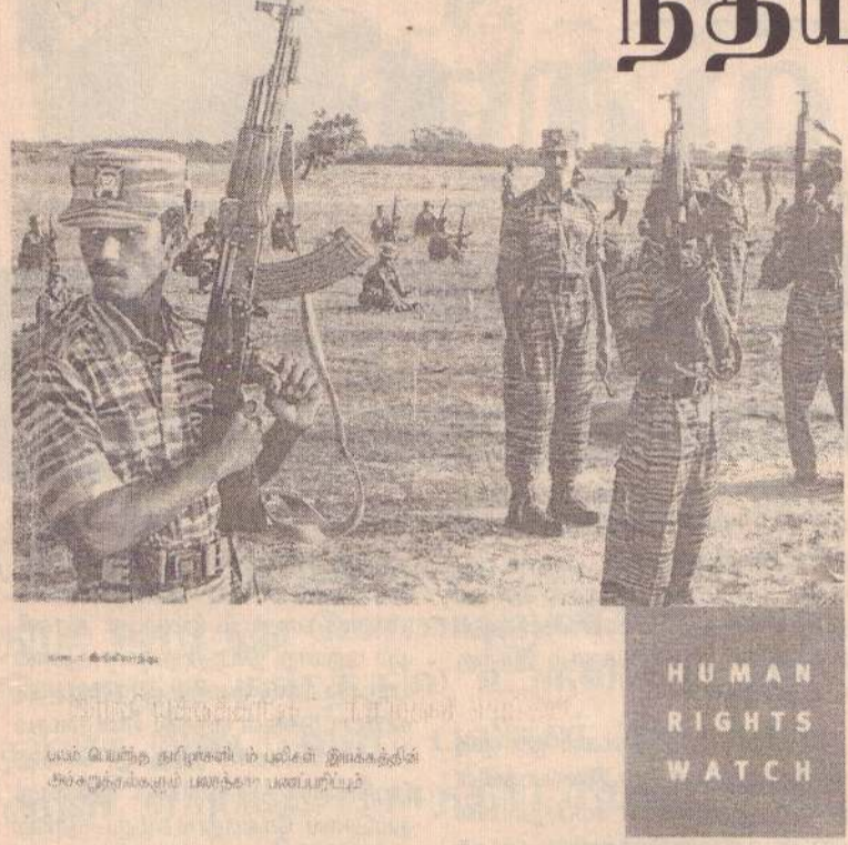
புலம் பெயர்ந்த தமிழர்கள், புலிகள் இயக்கத்தின் கட்டுப்பாட்டில் உள்ள பண்பாட்டு இடம்.

நிர்வாகத்தை கையளிக்க ஒப்புக்கொள்ளும் வரையில், 2005 முற்பகுதியில் அவர்கள் இருவரும் இலங்கையின் வட பகுதியில் பல வாரங்களாக தடுத்து வைக்கப்பட்டனர்.