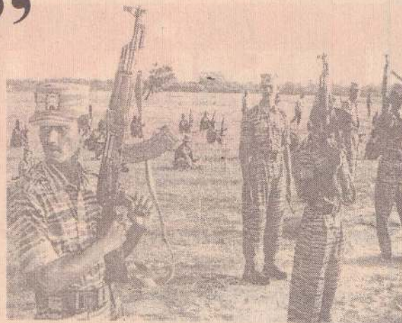
HUMAN RIGHTS WATCH

அந்த நிலைமை தொடர்பாக அவர் கவலையடைந்தாலும் தான் தொழில் இல்லாமையால் இருப்பதாகவும் அதன் காரணமாக தன்னிடம் தருவதற்கு பணம் இல்லை என்றும் அவர் விளக்கியதோ, நிதி வழங்க மறுக்கவும் முயற்சித்தார். ஆனால் புலிகள் இயக்கம் தன் மீது தொடர்ச்சியாக அழுத்தங்களை இருவதாக அவர் கூறினார். “நீர் இலங்கையை சேர்ந்தவர் என்றால், நீர் கட்டாயம் தந்துதான் ஆகவேண்டும். அது உமது பொறுப்பு. உமக்கு உமது குடும்பத்தை கவனிச்ச வேண்டும் என்றால் அது உமது பிச்சனை. ஆனால் நாங்கள் விடுதலைப் போராட்டத்திற்காகவே உம்மை பங்களிக்கச் சொல்கின்றோம். என அவர்கள் கூறினர்”. இறுதியாக தான் 2,000 பவுண்டுகள் வழங்குவேன் என உறுதிசூறி, அதற்கான ஒப்பந்தம் ஒன்றில் அவர் கையொப்பம் இட்டு இணக்கம் தெரிவிக்கும்வரை, ஒன்றரைமணி நேரத்திற்கு மேலாக புலிகள் இயக்கத்தின் பிரதிநிதிகள் அங்கு அமர்ந்திருந்தனர்.