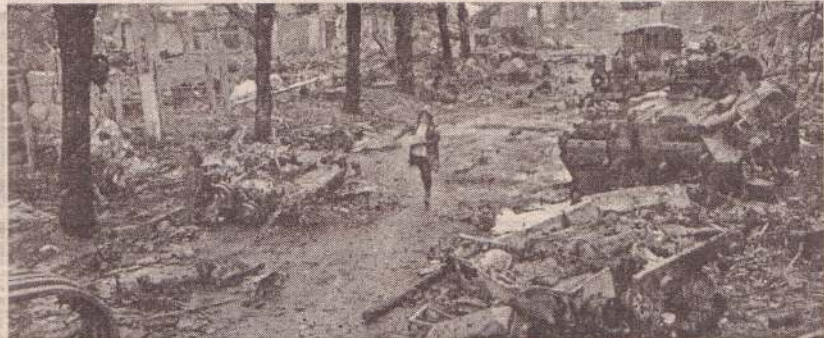
சாட்டி உள்ளது. இந்த நிலையில் கடந்த

வருகின்றன. தாக்குதல் 100 நாட்களை கடந்துள்ள நிலையில், தங்கள் நாட்டின் 20% பகுதிகள் ரஷ்யாவின் வசம் சென்றுவிட்டதாக உக்