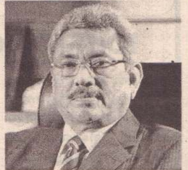
புற நுகர்வோர் குறைந்த விலையில் பொருட்களை கொள்வனவு செய்வதற்கும், விவசாயிகள் அதிக விலையை பெற்றுக் கொள்ளவும் முடியும் எனவும் ஜனாதிபதி தெரிவித்தார். (நி-6)