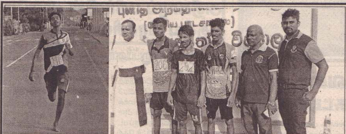
ஊர்காவற்றுறை புனித அந்தோனியசர் கல்லூரியின் 150 ஆவது ஆண்டு நிறைவை முன்னிட்டு வீதியோட்ட நிகழ்வு நேற்று வெள்ளிக்கிழமை நடைபெற்றது. குறித்த போட்டிகள் கனிஷ்ட தர மாணவர் பிரிவு, சிரேஷ்ட தர மாணவர் பிரிவு, கல்லூரியின் பழைய மாணவர் பிரிவு என மூன்று பிரிவுகளில் நடைபெற்றன.

கிரிக்கெட் சுற்றுப்பயணம் மேற்கொண்டுள்ள அவுஸ்திரேலியக் கிரிக்கெட் அணி, மூன்று இருபது-20 போட்டிகள், ஐந்து ஒருநாள் போட்டிகள் மற்றும் இரண்டு போட்டிகள் கொண்ட டெஸ்ட் தொடரில் விளையாடவுள்ளது. இரு அணிகளுக்கிடையில் முதலாவதாக நடைபெறும் முதல் இருபது-20 எதிர்வரும் 7ஆம் திகதி கொழும்பு ஆர்.பிரேமதாஸ மைதானத்தில் நடைபெறவுள்ளது. (4-6)