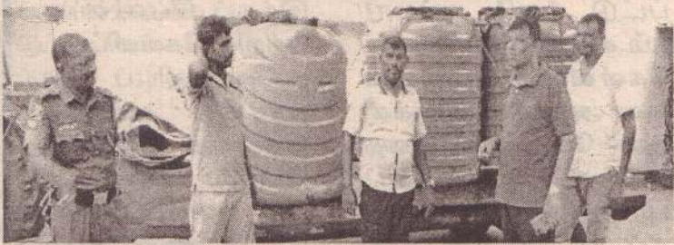
(அம்பாறை) பிரிவினர்கூட்டப் பட்டியடிப்பிட்ட பிரதேசத்தில் தேவைக்கு அதிகரைப்பற்று பொலிஸ்

கமாக பதுக்கி வைக்கப்பட்டிருந்த 3000 லீற்றர் டீசல் நேற்று முன்தினம் வியாழக்கிழமை அக்கரைப்பற்று பொலிஸாரின் அதிரடி நடவடிக்கை காரணமாக கைப்பற்றப்பட்டதுடன் சம்பந்தப்பட்ட ஒருவர் கைது செய்யப்பட்டுள்ளார். சூட்சுமமான முறையில் மூன்று நீர்த்தாங்கிகளில் சேகரிக்கப்பட்டு வைத்திருந்த 3000 லீற்றர் டீசலை இவ்வாறு கைப்பற்றப்பட்டது.