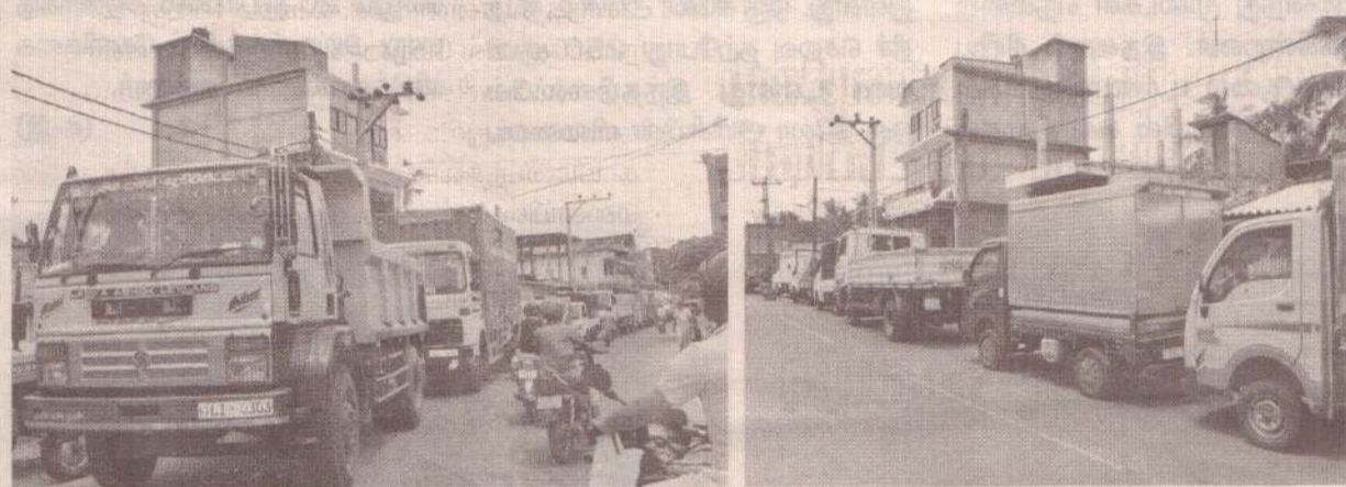
மட்டக்களப்பில் சில எரிபொருள் நிரப்பு நிலையங்களில் நேற்று டீசல் விநியோகிக்கப்பட்ட நிலையில், பொது மக்கள் மிக நீண்ட வரிசையில் நின்று தமது வாகனங்களுக்கு டீசலை நிரப்பிக் கொண்டனர். (ம-150)