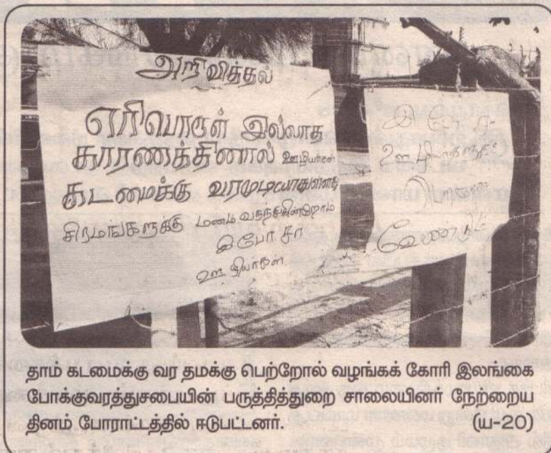
தாம் கடமைக்கு வர தமக்கு பெற்றோல் வழங்கக் கோரி இலங்கை போக்குவரத்துச்சபையின் பருத்தித்துறை சாலையினர் நேற்றைய தினம் போராட்டத்தில் ஈடுபட்டனர். (ய-20)

மன்னாரில் இருந்து சென்ற இருவரும் தமிழகம் சென்றடைந்தபோதும் இயலாமை காரணமாக மயக்கமுற்ற நிலையில், தனுஸ்கோடிக் கரையில் வீழ்ந்து கிடந்துள்ளனர். அதன்பின்னரே தமிழகப் பொலிஸாரால் இருவரும் மீட்கப்பட்டு சிகிச்சை வழங்கப்பட்டது. (ம-14-20)