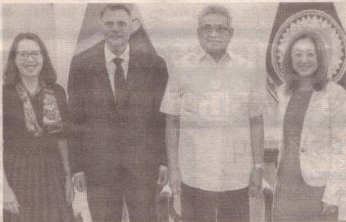
இலங்கைக்கு வந்துள்ள அமெரிக்க உயர்மட்ட இராஜதந்திர குழுவினர் நேற்றுத் திங்கட்கிழமை ஜனாதிபதி கோத்தாபய ராஜபக்சவைச் சந்தித்து கலந்துரையாடி உள்ளனர். இலங்கை வளமான எதிர்காலத்தை அடைவதற்கு அமெரிக்காவின் பூரண ஒத்துழைப்பைப் பெற்றுக் கொள்வது தொடர்பில் இந்தச் சந்திப்பில் கவனம் செலுத்தப்பட்டது என்று தெரிவிக்கப்பட்டது. (எ-இ)

மேல் மாகாணத்தில் அடையாளம் காணப்பட்டுள்ள 283 ஏக்கர் காணிகளில், காணிகள் அபிவிருத்தி செய்யும் கூட்டுத்தாபனம் பயிர்ச் செய்கையை ஆரம்பிக்கவுள்ளது. நகர அபிவிருத்தி மற்றும் வீடமைப்பு அமைச்சர் பிரசன்ன ரணதாங்க, நகர அபிவிருத்தி மற்றும் வீடமைப்பு அமைச்சின் கீழ் உள்ள நிறுவனங்களில் வெற்று நிலங்களை அடையாளம் கண்டு அவற்றைப் பயன்படுத்தி விரைவாக பயிர்ச்செய்கை ஆரம்பிக்கப்படவேண்டும் என்று அதிகாரிகர்களுக்கு ஆலோசனை வழங்கினார். அதன் ஒரு கட்டமாக இந்த வேலைத் திட்டம் நடைமுறைப்படுத்தப்படுகின்றது. இந்த வேலைத் திட்டத்தின் கீழ் இலங்கை காணிகள் அபிவிருத்தி செய்யும் கூட்டுத்தாபனத்தின் கீழ் உள்ள 188 ஏக்கர் நிலத்தில் விரைவாக பயிர்ச்செய்கை ஆரம்பிக்கப்படவிருப்பதோடு ஏற்கனவே 94 ஏக்கர் பரப்பளவுள்ள நிலத்தில் பயிர்ச்செய்கை ஆரம்பிக்கப்பட்டுள்ளது. நெல் மற்றும் குறுகிய காலப் பயிர்களை இந்த நிலங்களில் பயிரிடுவதற்குத் திட்டமிடப்பட்டுள்ளது. (எ-இ)