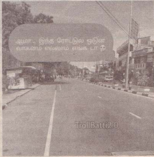
ஆமா.. இந்த ரோட்டுல ஒடுன வாகனம் எல்லாம் எங்க டிரா