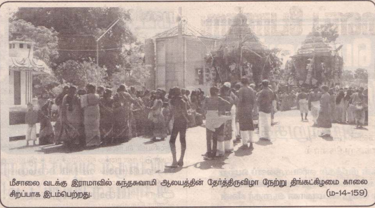
மீசாலை வடக்கு இராமாவில் கந்தசுவாமி ஆலயத்தின் தேர்த்திருவிழா நேற்று திங்கட்கிழமை காலை சிறப்பாக இடம்பெற்றது. (ம-14-159)