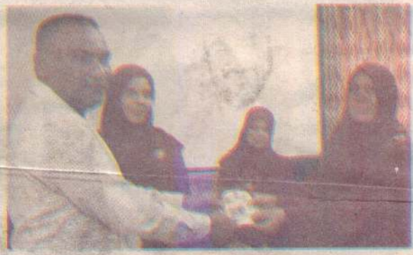
'ஒன்றாகப் பயிரிடுவோம் நாட்டைக் கட்டியெழுப்புவோம்' எனும் தொனிப்பொருளில் விவசாய உற்பத்தி கருத்தரங்கொன்று கலாசார அலுவல்கள் திணைக்களத்தின் அலுவலகத்தில், சாயந்தமருது பிரதேச செயலகத்தில் நேற்று இடம்பெற்றது.