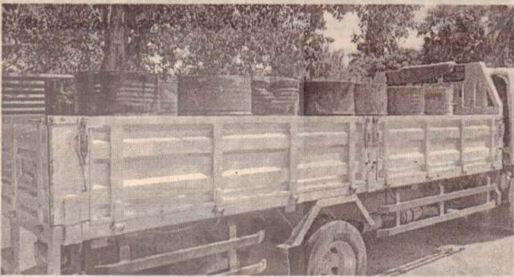
(குருமன்காடு) வவுனியா, வேப்பங்குளம் பகுதியில் உள்ள பிரபல ஹாட் வெயர் கடை ஒன்றில் பதுக்கி வைக்கப்பட்டிருந்த 3000 லீற்றர் டீசல் விசேட சோதனை நடவடிக்கையின் போது நேற்று மதியம் மீட்கப்பட்டுள்ளதாக நெளுக்குளம் பொலிஸார் தெரிவித்தனர். வவுனியா விசேட பொலிஸ் பிரிவுக்கு கிடைத்த தகவலையடுத்து நெளுக்குளம் பொலிஸார் வவுனியா, மன்னார் வீதி, வேப்பங்குளம் பகுதியில் அமைந்துள்ள பிரபல ஹாட் வெயர் கடை ஒன்றினை சோதனை செய்தனர். இதன்போது குறித்த ஹாட் வெயர் கடையின் களஞ்சிய சாலைப்பகுதியில் 15 பரல்களில் பதுக்கி வைக்கப்பட்டிருந்த 3000 லீற்றர் டீசல் கண்டு பிடிக்கப்பட்டது. இதனையடுத்து குறித்த 15 பரல்களில் காணப்பட்ட 3000 லீற்றர் டீசலும் நெளுக்குளம் பொலிஸாரால் மீட்கப்பட்டதுடன், அதனை உடைமையில் வைத்திருந்த குற்றச்சாட்டில் ஹாட் வெயர் கடையில் களஞ்சிய பகுதியில் கடமையாற்றும் நபர் ஒருவர் கைது செய்யப்பட்டுள்ளார். அவரிடம் மேலதிக விசாரணைகளை முன்னெடுத்துள்ள நெளுக்குளம் பொலிஸார் விசாரணைகளின் பின் நீதிமன்றில் முற்படுத்த நடவடிக்கை எடுத்துள்ளதாக தெரிவித்தனர். (நி-6-250)