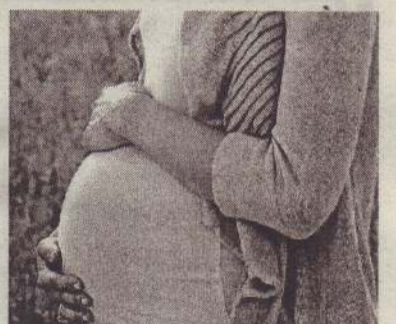
வேண்டுமென தெரிவிக்கப்பட்டுள்ளது. (நி)

எனவே பிரசவவலி ஏற்படும் அறிகுறிகள் தென்படும் போதே மருத்துவமனைகளில் சேர்வதற்கு கர்ப்பிணித்தாய் மார்கள் நடவடிக்கை எடுக்க