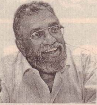
(கொழும்பு) நாட்டில் தற்போது நிலவும் நெருக்கடி நிலைக்கு மத்தியில்