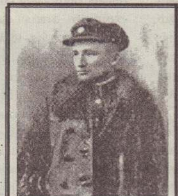
ஆண்ட்ரி மெல்னிக் (Andriy Alanasovich Melnyk) ஒரு உக்கரைனிய இராணுவ மற்றும் அரசியல் தலைவர்