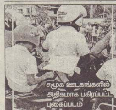
சமூக ஊடகங்களில் அதிகமாக பகிரப்பட்ட புகைப்படம்