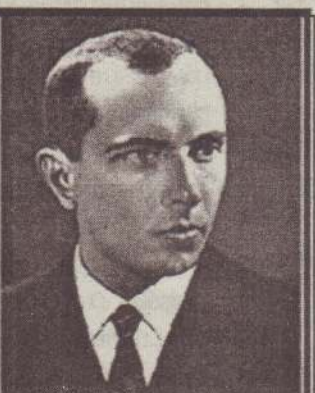
ஸ்டெபன் பண்டேரா Stepan Bandera உக்கரைனிய தேசியவாத

மானது என்று அறிவித்தது மற்றும் OUN இன் தலைவராக பண்டேராவைத் தேர்ந்தெடுத்தது. OUN இவ்வாறு இரண்டு தனித்தனி பிரிவுகளாகப் பிரிந்தது. OUN-Melnyk அல்லது OUN-M, மிதவாதப் பிரிவாகவும் OUN-பண்டேரா அல்லது OUN-B, புரட்சிகரப் பிரிவாகவும் இருந்தது. உக்கரைனிய பிரதேசத்தில் இயங்கும் பெரும்பாலான OUN பணியாளர்கள் பண்டேராவின் தலைமையை ஏற்றுக்கொண்டனர்.