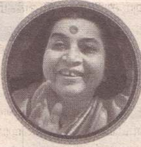
H. H. SHRI MATAJI NIRMALA DEVI

Come and Enjoy Your Spirit! Indian Cultural Music and Dance program