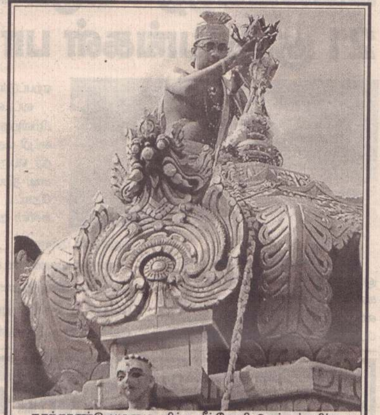
நூற்றாண்டு பழமை மிக்க நீர்வேலி செல்லக்கதிர்காம முருகன் ஆலயத்தின் மஹா கும்பாபிஷேகம் அண்மையில் இடம்பெற்றது.

குறித்த பரீட்சைகள் யாழ்ப்பாணம் நாவலர் மகா வித்தியாலயம், மட்டக்களப்பு மெதடிஸ் பெண்கள் வித்தியாலயம், கொழும்பு பம்பலப்பிட்டி இந்துக் கல்லூரி ஆகிய பரீட்சை நிலையங்களில் நடைபெறவுள்ளது. (4)