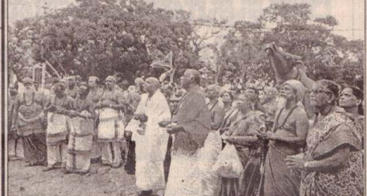
சிவபூமி அறக்கட்டளை நிர்வாகத்தின் ஏற்பாட்டில் தென்னிந்திய சிற்பக் கலைஞரால் நிர்மாணிக்கப்பட்ட சூமார் 27 அடி உயரமான சிவன் திருவுருவச்சிலை மற்றும் நந்தியெயம்பெருமானின் திருவுருவச் சிலைகள் நேற்றுக் காலை திருக்கேதீச்சர பாலாவி தீர்த்தக்கரை அருகே திறந்து வைக்கப்பட்டன.

இதேவேளை, கிளிநொச்சி மாவட்டத்தில் டீசல் லீற்றர் ஒன்று 1700 ரூபாவிற்கும், பெற்றோல் லீற்றர் ஒன்று 3000 ரூபாவிற்கும், மண்ணெண்ணெய் லீற்றர் ஒன்று 1500 ரூபாவிற்கும் கறுப்பு சந்தையில் விற்பனை செய்யப்பட்டு வருகின்றமையும் இங்கு குறிப்பிடத்தக்கது. (4-6-100-316)