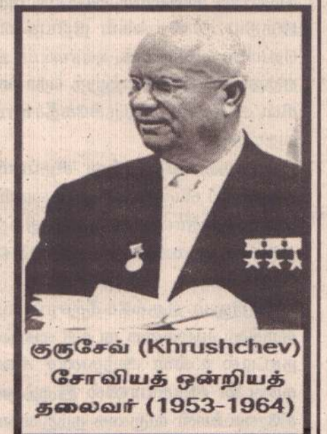
குருசேவ் (Khrushchev) சோவியத் ஒன்றியத் தலைவர் (1953-1964)

னிச உலகை திகைக்க வைத்தார், மேலும் அவரது முக்கிய கூட்டாளியான அனஸ்டாஸ் மிகோயனுடன் ஸ்டாலின் கொள்கையை மாற்றும் நடவடிக்கையைத் தொடங்கினார். இது குறிப்பாக உக்கரைனுக்கு முக்கியத்துவம் வாய்ந்ததாக இருந்தது.