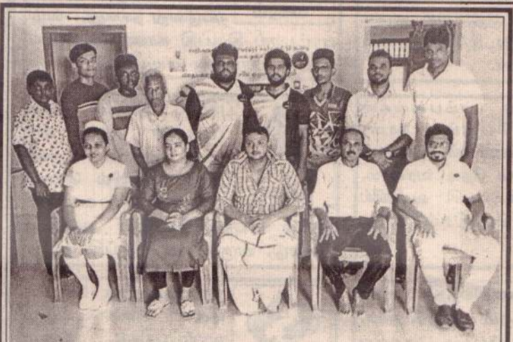
அமரர்.நாகலிங்கம் தெய்வேந்திரத்தின் முதலாம் ஆண்டு நினைவை முன்னிட்டு விதையனைத்தும் விருட்சமே குழுமத்தின் ஏற்பாட்டில் மாபெரும் இரத்தான முகாம் நிகழ்வு அண்மையில் தாவுடி அம்பலவாணர் வேதவிநாயகர் நூலு மண்டபத்தில் நடைபெற்றது.

யைச் சேர்ந்த 70 வயதான முதியவர் மற்றும் அவருடைய 18 வயதான பேர்த்தி ஆகியோர் படுகாயமடைந்த நிலையில் சாவகச்சேரி ஆதார மருத்துவமனையில் அனுமதிக்கப்பட்டதன் பின்னர் மேலதிக சிகிச்சைக்காக யாழ்.போதனா மருத்துவமனைக்கு அனுப்பி வைக்கப்பட்டுள்ளனர். குறித்த விபத்துத் தொடர்பான மேலதிக விசாரணைகளை சாவகச்சேரிப் பொலிஸார் முன்னெடுத்து வருகின்றனர். (4-6-30)