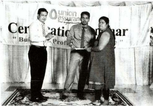
Union Assurance Awarding function

ஏழாலை மேற்கு சைவ சன்மார்க்க முன்பள்ளி தொடக்க ஆசிரியராக கடமையாற்றிய போது