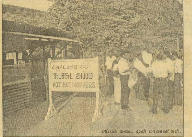
அப்பக் கடை முன் மாணவர்கள்.