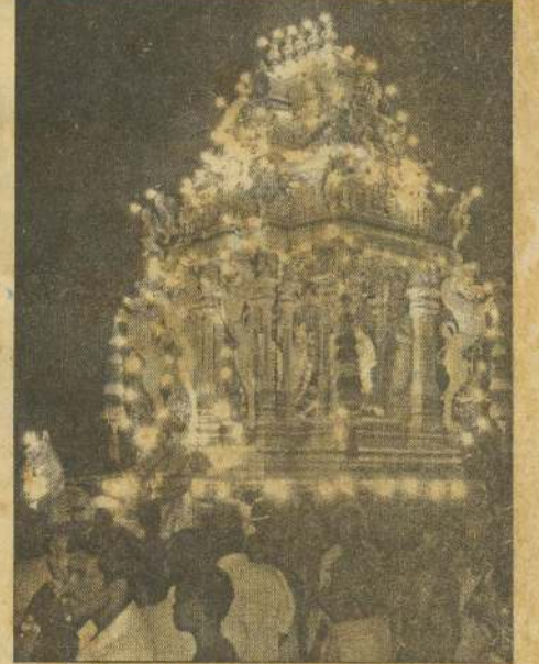
நேற்று நல்லூர் ஆலய 10ஆம் திருவழி வரலாறு மஞ்சத்தில் வள்ளி, தெய்வானை சமேதராக உலாவரும் முத்துக்குமாரகலாம்.

தங்களது உளவாளிகளாகச் செயற்படுகின்றவர்கள் பலர் குறித்து வெளியில் தகவல் (16ஆம் பக்கம் பார்க்க)