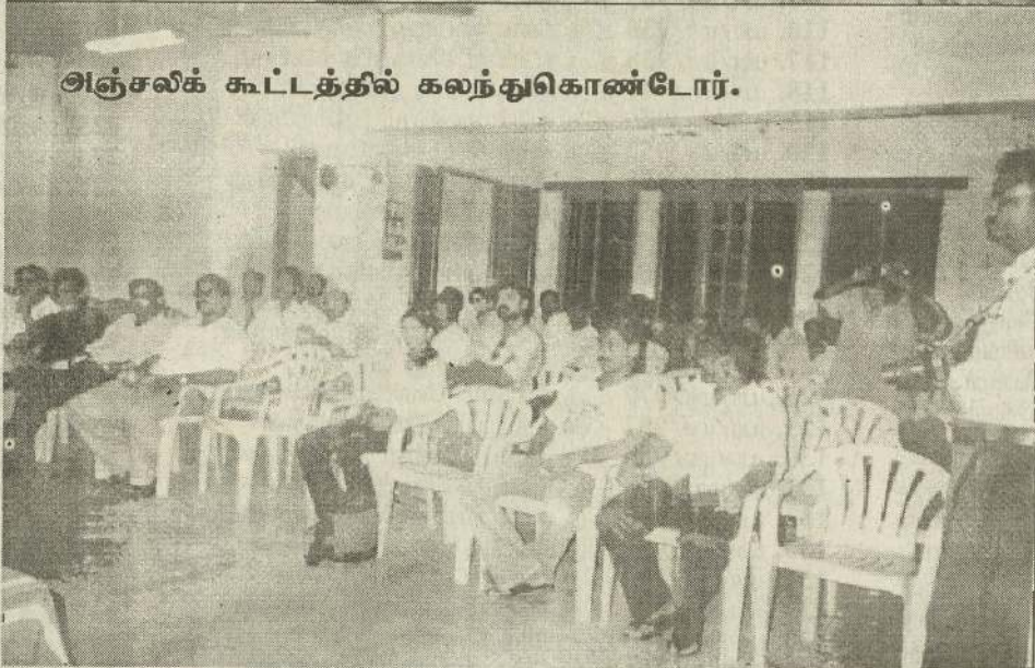
அஞ்சலிக் கூட்டத்தில் கலந்துகொண்டோர்.