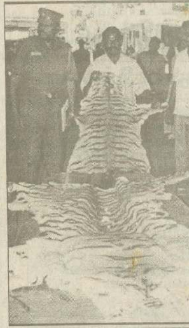
சென்னையை அடுத்த மணலி ரயில்வே கேட் அருகே நின்ற 4 பேரகக் காவல் துறையினர் பிடித்து போதனையிட்டதில் சிவர்களிடம் கிருஷ்ண 2 புல்தேவால்களும், மான் கொம்புகளும் கைப்பற்றப்பட்டது. சிவற்றின் மதிப்பு 12 கிலோசாம் ரூபா என்கிறது காவல்துறை.

தமிழகத்தில் தோட்டத் தொழிலாளர்கள் இன்னமும் கொத்தடிமைகளாகவே நடத்தப்படுகின்றனர். வேலைப்பழு தற்போது இரு மடங்காக அதிகரிக்கப்பட்டுள்ள தோடு சம்பளமும் குறைக்கப்பட்டுள்ளது. 8 மணிநேர வேலை என்பதே இல்லாமல் போய்விட்டது. புதிய தமிழகம் தவிர மற்ற அனைத்துத் தொழிற் சங்கங்களும் தொழிலாளர்களைத் தொடர்ந்து ஏமாற்றி வருகின்றன. இந்த நிலை வெகு நாட்களுக்கு நீடிக்காது என்றார்.