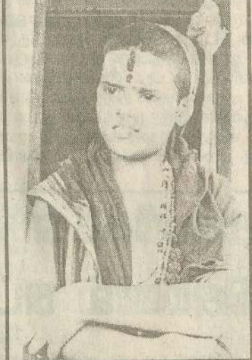
துறவி கடந்த ஞாயிற்றுக்கிழமை சென்று சிறப்புப் பூசை நடத்தி ஒரு மரக்கன்றை நட்டார். தொடர்ந்து அவரது சீடர்கள், பக்தர்கள் மூலம் 100 க்கும் மேற்பட்ட மரக்கன்றுகள் நடப்பட்டன. (உ-)

சேலம் தருமபுரி மாவட்ட எல்லையான தொப்புர் அருகே யுள்ள ஈசல்பட்டி பகுதிக்கு இளந்