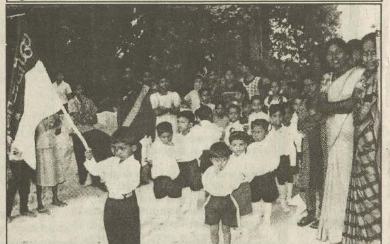
அண்மையில் கிடம்பெற்ற சாவகச்சேரி வடக்கு மண்டுவில் ஐங்கரன் முன்பள்ளி விளையாட்டு விழாவில் பாலர்களின் அணிவகுப்புக் காட்சியைப் படத்தில் காணலாம்.