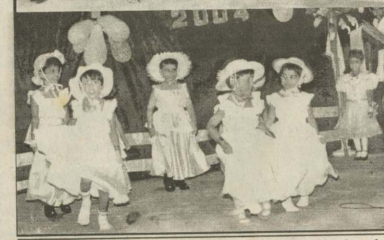
கரவெட்டி குழந்தை கியேசு முன்பள்ளிச் சிறார்கள்ளின் பெற்றோர் தினவிழாவில் பிரதம விருந்தினர்களை முன்பள்ளியின் பாண்ட் வாத்தியக்குழுவினர் வரவேற்று அழைத்துச் செல்வதை முதலாவது படத்திலும், அந் நிகழ்வில் இடம்பெற்ற முன்பள்ளிச் சிறார்கள்ளின் நாட்டிய நிகழ்வின் கிரண்டாவது படத்திலும் காணலாம்.