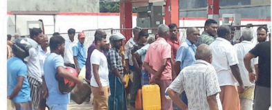
நற்பிட்டி முனை பிரதேச மக்கள் மன்றமேற்பாட்டுப் பெரு நேற்று (06) பெற்றோல் நிலையத்தில் நீண்ட வரிசையில் காத்திருப்பதை அவதானிக்கக்கூடியதாக இருந்தது.

இவ்வகையில் மாணவர்களின் மூலம் விழிப்புணர்வு மையம் மூலம் அவர்களுடைய பாதுகாப்பை அவர்களின் உறுப்பினர்களுக்கு தெரிவித்துள்ளனர்.