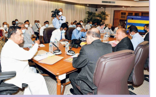
விமானப் பயணிகளுக்கு பெற்றுக் கொடுக்கும் முகாமலே இந்த புதிய கட்டுமானப் பணிகளை முன்னெடுக்க தீர்மானிக்கப்பட்டது. எனவே இவ்வாறு குவென்சுரூபு உட்பட அதிகாரிகளும் கருத்து கொள்ளும்.

பணிகளுக்கான ஒப்பந்தமானது கடந்த 8 வருடங்களுக்கு முன்பாகவே கையொப்பம் செய்யப்பட்டுள்ளது. ஆனால், இன்று வரை குறிப்பிட்ட கட்டணங்களை இதுவரை பணிகளை முன்னெடுக்காமல் காணவில்லை. இதன் மூலம் பயணிகளுக்கான ஒரு பகுதியும் விமான நிலைய கட்டுமானப் பணிகள் முன்னெடுக்கப்படவில்லை. இதற்காக திட்டமிடப்பட்ட தொகையானது 1.3 பில்லியன் ரூபாயாகும். அதற்கான தொகையை ஜப்பான் நிறுவனமான ஜப்பான் வழங்கியுள்ளது. இந்த கட்டுமானப் பணிகள் கடந்த 2019 மற்றும் 2020ஆம் ஆண்டு காலப்பகுதியில் ஆரம்பிக்கப்பட்டது. ஆனால், தற்போது இரண்டு வருடங்களை கடந்துள்ள நிலையில் இன்ன பணிகள் மிகவும் மந்தநிலையிலேயே கிடந்து வருகின்றன. அதே நேரத்தில் இரண்டாம் குறியீடானது சர்வதேச விமான நிலைய கட்டுமானங்களுக்கு அமைப்பதற்கே திட்டமிடப்பட்டிருந்தது. ஆனால், தற்போது அது சர்வதேச நியமனங்களுக்கு மாறாகவும் பாதுகாப்பு உரிமைகளுக்கு மாறாகவும் அமைப்பதற்கு திட்டமிடப்பட்டுள்ளதாக தகவல்கள் கிடைத்துள்ளன. பணிகளை தொடர்புபடுத்தி நிறுவனத்தின் பொறுப்பே உரிய காலத்தில் பணிகளை நிறைவு செய்ய வேண்டியது இந்த தாமதத்திற்கு எரிபொருள் தட்டுப்பாடு ஒரு விடயமாக அமைந்துள்ளது. அதே நேரத்தில் மேலதிகமாக தெரிவு செய்யப்பட்டுள்ள கொந்தரத்துகாரர்கள் தொடர்பாகவும் பரிசு சந்தேகம் நிலவுகின்றது குறிப்பிட்ட ஒப்பந்தக்காரர்கள் உரிய தகுதியை கொண்டிருக்காதவர்கள் என்பது தொடர்பாகவும் சந்தேகம் நிலவுகின்றது. எனவே இது தொடர்பாக உரிய விளரணனைகள் முன்னெடுக்குமாறு விமான நிலைய அதிகாரிகளுக்கு பணிப்பாள் சபைக்கும் அனுப்பியுள்ளோம். மேலும், இந்த கட்டுமானப் பணிகளை சிறந்த தரம் வாய்ந்த ஒரு சேவையை