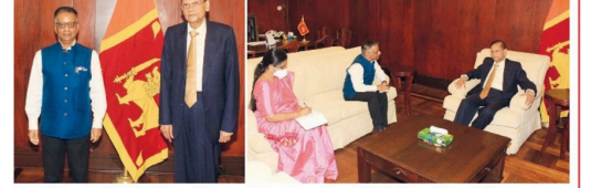
அன்விவான இந்திய உதவிகளை இந்த நெருக்கடியான நேரத்தில் இலங்கை அரசாங்கம் ஆழமாக பாராட்டுவதாக வெளிநாட்டு அலுவலர்கள் அமைச்சர் பீரிஸ் தெரிவித்தார். பவ்வான்குளாக நெருங்கிய அன்வான நெருக்கடி திகழும் இர நாடுகளுக்கு ஆழமாக பாராட்டுவதாக வெளிநாட்டு அலுவலர்கள் அமைச்சர் பீரிஸ் தெரிவித்தார்.