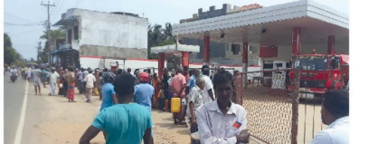
நற்பிட்டி முனை பிரதேச மக்கள் மன்றமேற்பாட்டுப் பெரு நேற்று (06) பெற்றோல் நிலையத்தில் நீண்ட வரிசையில் காத்திருப்பதை அவதானிக்கக்கூடியதாக இருந்தது.