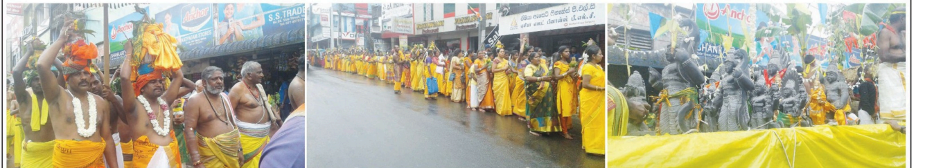
ஹட்டன் டம்பர் சிங்கேரையில் அமைந்துள்ள பள்ளி ஸ்ரீமதுமாரியம்மன் ஆலய குடும்பினேகம் எதிர்வரும் 9ஆம் திகதி நடவெறுவதை முன்னிட்டு நேற்று பாலுட்பலி இடம்பெற்றதை கணவரம்.

மீண்டும் ஆரம்பிக்கப்பட்டவுடன் ரஷ்யாவுக்கான தபால் சேவைகள் மீண்டும் ஆரம்பிக்கப்படும் எனவும் தெரிவித்துள்ளார்.