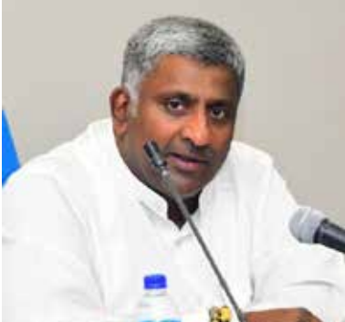
நாடாளுமன்ற உறுப்பினர்களுக்கு 101 புதிய வீடுகளை கட்டிக்

கொடுப்பதற்கு அமைச்சரவைப் பத்திரத்தை நகர அபிவிருத்தி மற்றும் வீடமைப்பு அமைச்சர் பிரசன்ன ரணதுங்க சமர்ப்பித்துள்ளார்.