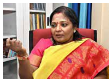
லாவுக்கு அனுமதி அளிக்க மாட்டோம். என்று தெரிவித்திருக்கிறார்.

சுற்றுலா வை மேம்படுத்த வேண்டும் என்பதே அரசின் எண்ணம். அதே நேரத்தில் வருமானம் வரும் என்பதற்காக இளைஞர்களை யோ மக்களையோ பாதிக்கும் கலாசாரச் சீர்கேடான சுற்று