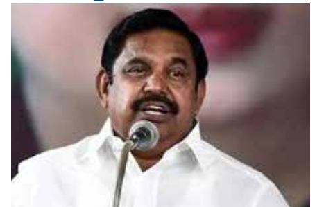
தெரிந்தே கொல்லப்போகிறது இந்த ஒன்லைன் சூதாட்டம்?, என்று கேள்வி எழுப்பியுள்ளார்.

இளம்பெண் தூக்கிட்டு தற்கொலை செய்துள்ள நிலையில், தமிழகம் முழுவதும் அனைத்து பத்திரிகையிலும் இன்று முழு முதற்பக்க ஒன்லைன் ரம்மி விளம்பரம் வருகிறது. காவல்துறை டி.பி.யே ஒன்லைன் ரம்மி அல்ல, அது ஒன்லைன் மோசடி, உங்கள் உயிரைக் கொல்லலாம். என வெளிப்படையாக எச்சரிக்கும் நிலையிலும் கூட, இந்த உயிர்க்கொல்லி ஒன்லைன் சூதாட்டங்களைத் தடை செய்ய நடவடிக்கை எடுக்காதது ஏன்? யாருடைய அழுத்தத்தால் இந்தத் தயக்கம்? இன்னும் எத்தனை உயிர்களை