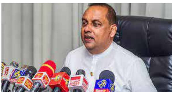
குழு கூட்டத்தில் பிரதமர் ரணில் விக்கிரமசிங்க, முன்னாள் பிரதமர் மஹிந்த ராஜபக்ஷ மற்றும் அரசாங்க அமைச்சர்கள் பலர் கலந்துகொண்டனர் என்பது குறிப்பிடத்தக்கது.

ஜனாதிபதி கோட்டாபய ராஜபக்ஷ தலைமையில் ஜனாதிபதி செயலகத்தில் நடைபெற்ற ஆளும் கட்சி பிரதிநிதிகள்