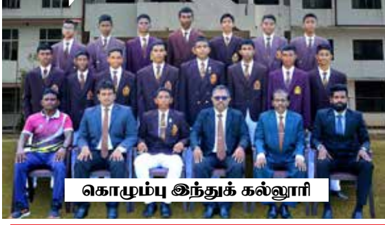
கொழும்பு இந்துக் கல்லூரி

யாழ்ப்பாணம் இந்துக் கல்லூரி மற்றும் கொழும்பு இந்துக் கல்லூரி ஆகியன மோதும் 'இந்துக்களின் போர்' என வர்ணிக்கப்படும் 11 ஆவது மாபெரும் துடுப்பாட்டச் சமர் நாளையதினம் (வெள்ளிக்கிழமை) ஆரம்பமாகவுள்ளது.