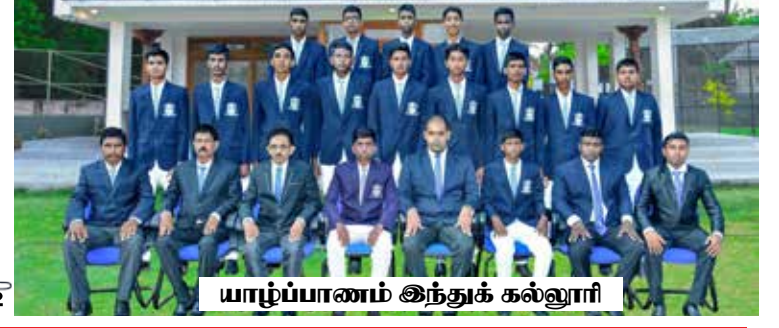
யாழ்ப்பாணம் இந்துக் கல்லூரி

யாழ்ப்பாணம் இந்துக்கல்லூரி மைதானத்தில் நாளையதினம் காலை 08 மணியளவில் ஆரம்ப நிகழ்வுகள் மற்றும் வீரர்கள் அறிமுகத்துடன் தொடங்கவுள்ள இந்துக்களின் போர் துடுப்பாட்டப் போட்டி, நாளை 10 ஆம் திகதி மற்றும்