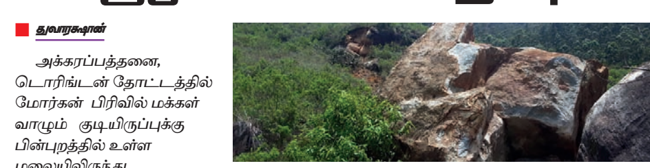
டொரிங்டன் தோட்டத்தில் டொரிங்டன் பிரிவில் மக்கள் வாழும் குடியிருப்புக்கு பின்புறத்தில் உள்ள மலையிலிருந்து பாரிய கற்பாறைகள் நேற்று முன்தினம் (8) காலை 8 மணியளவில் சரிந்து விழுந்ததால் அப்பகுதியில் வாழும் 20 குடும்பங்களைச் சார்ந்த 70க்கும் மேற்பட்டவர்கள் தொற்று அச்சத்தில் உள்ளனர். இத்தோட்டம் அமைந்திருக்கும் பகுதியில் பாரிய அளவிலான கற்பாறைகள் காணப்படுகின்றன. இதனால் மழைக் காலங்களில் அடிக்கடி கற்பாறைகள் சரிந்து விழக்கூடிய ஆபத்தான நிலைமையைக் காணக்கூடியதாக இருக்கும். மூன்று வருடங்களுக்கு முன்பு, அதே பகுதியில் பாரிய கற்பாறைகள் சரிந்து

விழுந்ததால், அங்கு வாழ்ந்த 50க்கு மேற்பட்டவர்கள் தோட்டத்திலுள்ள பொது மண்டபமொன்றில் தங்க வைக்கப்பட்டனர். அதன்பின் இம் மக்களின் பாதுகாப்பு கருதி, இந்திய விடமைப்பு திட்டத்தின் ஊடாக 46 தனி வீடுகள் கட்டப்பட்டு அதில் குடியமர்த்தப்பட்டனர். இன்னும் எஞ்சிய குடும்பங்களைச் சேர்ந்தவர்கள் பாதிப்பான குடியிருப்பு பகுதியில் தொடர்ந்து வாழ்ந்து வருகின்றனர். அத்தோடு இரவு நேரங்களில் சிறு பிள்ளைகளை வைத்துக்கொண்டு மழைக் காலங்களில் உயிர் அச்சத்துடன் வாழ்வதாக இவர்கள் குறிப்பிடுகின்றனர். சரிந்து விழுந்த கற்களும் ஆங்காங்கே ஆபத்தான நிலையில் தங்கி நிற்பதை காணமுடிக்கிறது. பாதிக்கப்பட்ட மக்கள் கருத்து தெரிவிக்கையில் ஒவ்வொரு நாளும் இரவு பொழுதை மிகவும் அச்சத்துடன் கழிப்பதாகவும் அதிகாரிகள் எவரும் எங்களுடைய பிரச்சினைகளை கவனிப்பதில்லை எனவும் தெரிவித்தனர். கற்பாறைகள் தொடர்ந்து சரிந்து விழுவதால், உயிர் ஆபத்துகள் ஏற்பட்ட கூடும்; உரிய அதிகாரிகள் தமக்கு உடனடியாக பாதுகாப்பை வழங்குவதோடு புதிய வீடுகளை அமைத்து தர கோரிக்கை விடுத்தனர்.