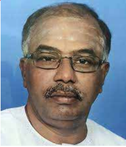
இலங்கைத் திருநாடு இன்று சீரழிந்து வாழும் வழி தெரியாது தவிக்கிறது. அறங்களைப் பேணாத காரணத்தாலும்

பொருளாதார வளங்களை அறிவுரீதியில் திட்டமிடாத காரணத்தாலும் இன்று இந்நாடு கையேந்தித் தவிக்கின்றமை துக்கமாகவும் வெக்கமாகவும் உள்ளது. அறம் பிழைக்கின்ற போதெல்லாம் நாடு அழிவை நோக்கும் என்பதை அற நூல்கள் நன்கு எடுத்துரைக்கின்றன. இனிமேல் லாவது ஆட்சி அதிகாரத்தில் உள்ளவர்கள் எல்லோரையும் சமமாகக் கருதிச் செயற்பட வேண்டும்.