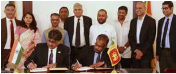
இந்திய எக்ஸிம் வங்கி ஊடாக டொலர் கடனைப் பெறுவதற்கான ஒப்பந்தத்தில் நிதி