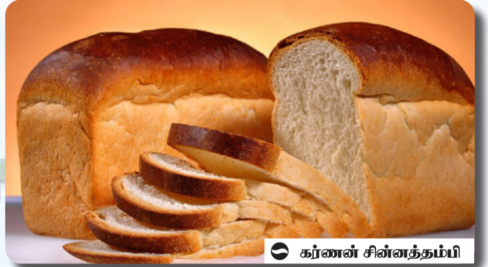
☉ கர்ணன் சின்னத்தம்பி